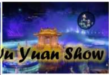
Introducing - Wu Yuan Show