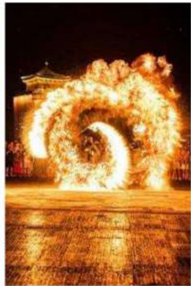
Melted Metal-Firework Show

รายการพิเศษ (Optionเสริม รายการที่ 1) โชว์แรกพบที่อุ้ยหยวน การแสดงที่บอกเล่าเรื่องราวของเมืองอุ้ยหยวนจากครั้งอดีต (ชำระเพิ่ม 2,000 บาท/ท่าน)