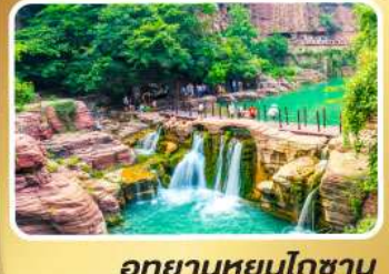
อุทยานหยุ่นโกซ่าน