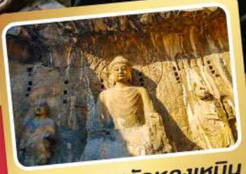
ผาแกะสลักหลงเหมิน