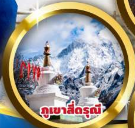
กุหาสีดรุณี