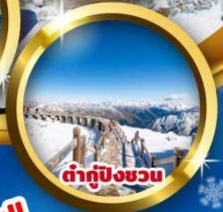
ต่ากู่ปิงชว่น