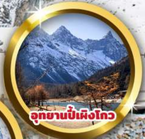
อุทยานปี้เฟิงโกว