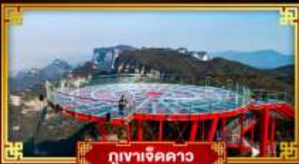
กูเขาเจ็ดดาว