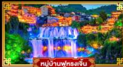
หมู่บ้านฟุทงเจิน