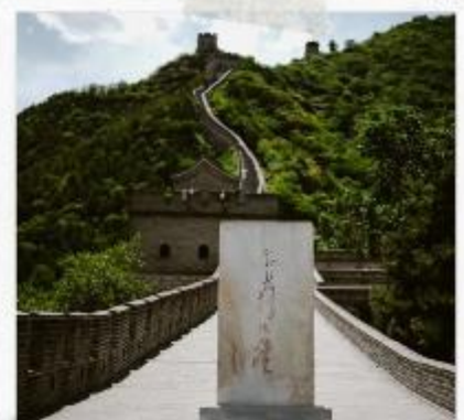
กำแพงเมืองจีน ด่านจวิหยงกวน