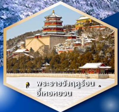
พระราชวังฤดูร้อน อู่เท่หยวน