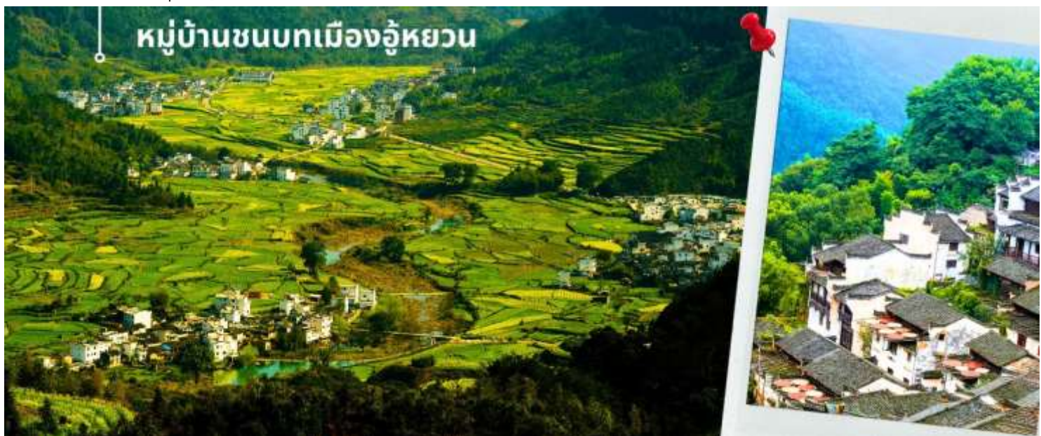
หมู่บ้านชนบทเมืองอู๋หยวน

นำท่านเดินทางสู่ หมู่บ้านชนบทเมืองอู๋หยวน ใช้เวลาเดินทางประมาณ 1.30 ชั่วโมง “เมืองชนบท ที่งดงามที่สุดของประเทศจีน” เป็นเมืองที่ธรรมชาติกลมกลืนกับวิถีชาวบ้านที่เป็นอยู่อย่างเรียบง่ายได้อย่างลงตัว บ้านเก่าแก่ที่อนุรักษ์ไว้อย่างดี สีสันความงามจากธรรมชาติหมุนเวียนไปตามฤดูกาล ทำให้นักท่องเที่ยวได้สัมผัสบรรยากาศที่แตกต่างกันออกไป ตามแต่ฤดูที่มาเยือนเมืองอู๋หยวนแห่งนี้ ซึ่งชาวบ้านยังคงใช้ชีวิตอย่างเรียบง่าย ใช้ชีวิตสบายๆ ริมสายน้ำ ในพื้นที่สีเขียวที่โอบล้อมด้วยภูเขาด้วยความห่างไกลเมือง และข้อจำกัดเรื่องการเดินทางเข้าถึงในสมัยก่อน ช่วยปกป้องให้อู๋หยวนยังคงรักษาธรรมชาติและวิถีชีวิตแบบดั้งเดิมไว้ได้ แม้ว่าปัจจุบันการเดินทางมาที่อู๋หยวนจะสะดวกสบายขึ้นมาก และการพัฒนามาก็เข้าถึงทุกหมู่บ้าน แต่โชคดีที่ผู้คนได้เรียนรู้แล้วว่า พวกเขาโหยหาและยังต้องการให้มีหมู่บ้านที่มีบรรยากาศแบบนี้ต่อไป ดังนั้น อู๋หยวนจึงยังคงความบริสุทธิ์อยู่ได้ ภายใต้กระแสการพัฒนาสมัยใหม่ของจีน