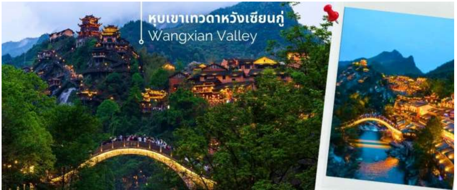
หุบเขาเกวตาทวังเซียนกู่ Wangxian Valley