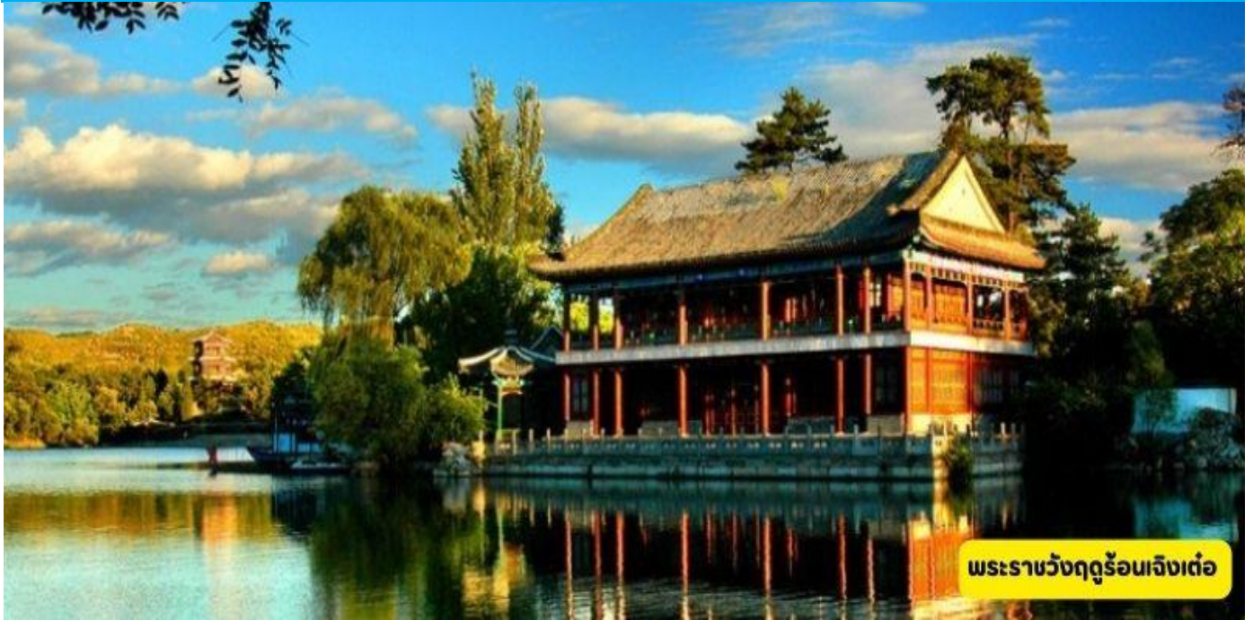
พระราชวังฤดูร้อนเจิ้งเต๋อ

กรุงเทพฯ สุวรรณภูมิ - ท่าอากาศยานนานาชาติปักกิ่ง TG614 :10.10 - 15.50 น. - เมืองจินเต๋อ