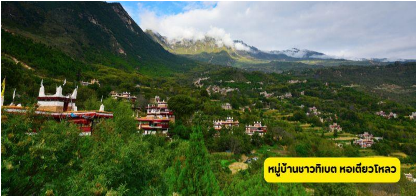
หมู่บ้านชาวทิเบต หอเดียวโหลว

เช้า ๑๐ รับประทานอาหารเช้า ณ โรงแรม นำท่านเที่ยวชม หมู่บ้านชาวทิเบต (ระยะทางประมาณ 120 กิโลเมตร ใช้เวลาเดินทางประมาณ 2 ชั่วโมง) ตั้งอยู่ในหุบเขาหมู่บ้านเจียจู่จั้งไซ่ สร้างขึ้นจากไม้และหิน ชั้นล่างสุดใช้เป็นที่เลี้ยงสัตว์ ชั้นถัดมาจะเป็นที่อยู่อาศัยของเจ้าของบ้าน ส่วนคาตฟ้าใช้สำหรับตากพืชผลทางการเกษตร ลักษณะบ้านสวยโดดเด่นกว่าที่อื่นในต้นป่า ชมหอเดียวโหลว ป้อมโบราณของต้นป่า ที่มีรูปทรงหลากหลาย