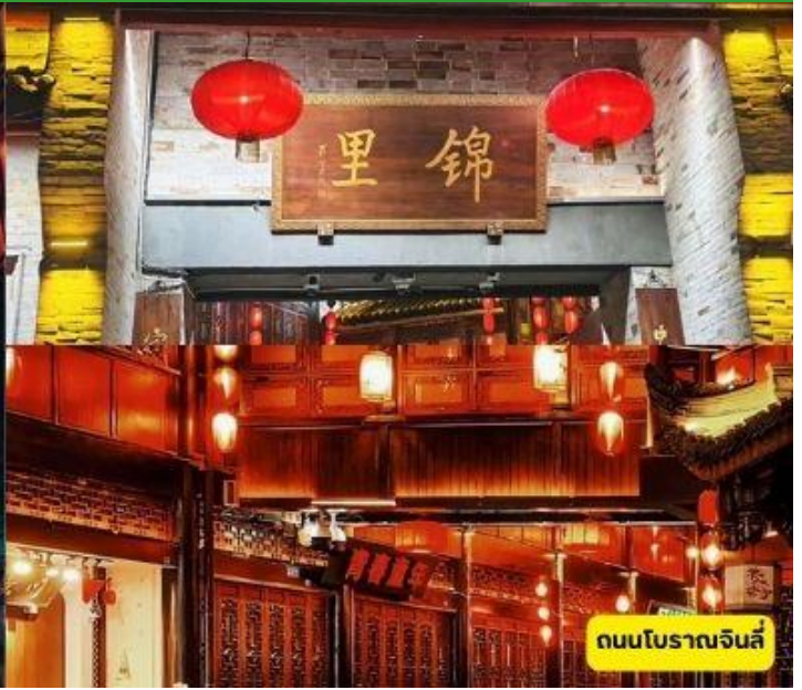
ถนนโบราณจินลี่