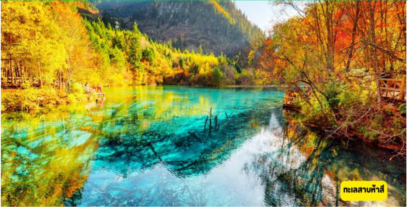
ทะเลสาบห้าสี