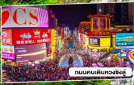
ถนนคนเดินหวงซิงอู่