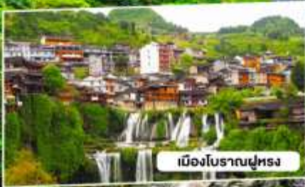
เมืองโบราณผู้หลง