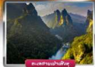
ทะเลสาบเวาเพิงหวง