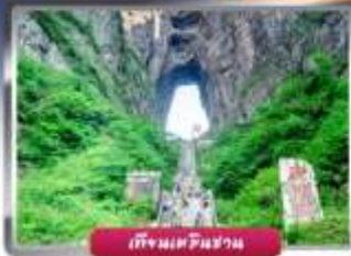
เทียนจินซาน