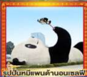
รูปปั้นหมีแพนด้าอนเซลฟ์