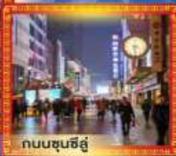
ถนนชุนชิว