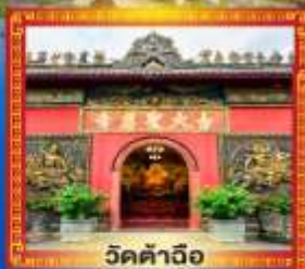
วัดคำฉือ