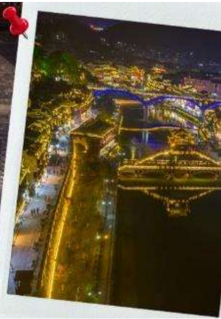
Shiban Street ถนนโบราณซีอาน