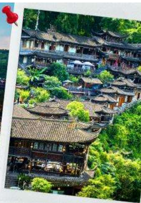
Furong Ancient Town เมืองโบราณฝูหรงเจิน

เมืองโบราณ ซึ่งเป็นการเพิ่มเสน่ห์ให้กับเมืองโบราณแห่งนี้