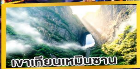
เขาเทียนเหมินซาน