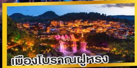
เมืองโบราณฟูหรง