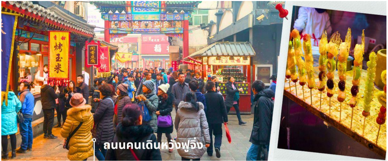
ถนนคนเดินหวังฟูจิ่ง

นำท่านเข้าสู่ที่พัก HOLIDAY INN EXPRESS HOTEL ★ ★ ★ ★ หรือเทียบเท่า