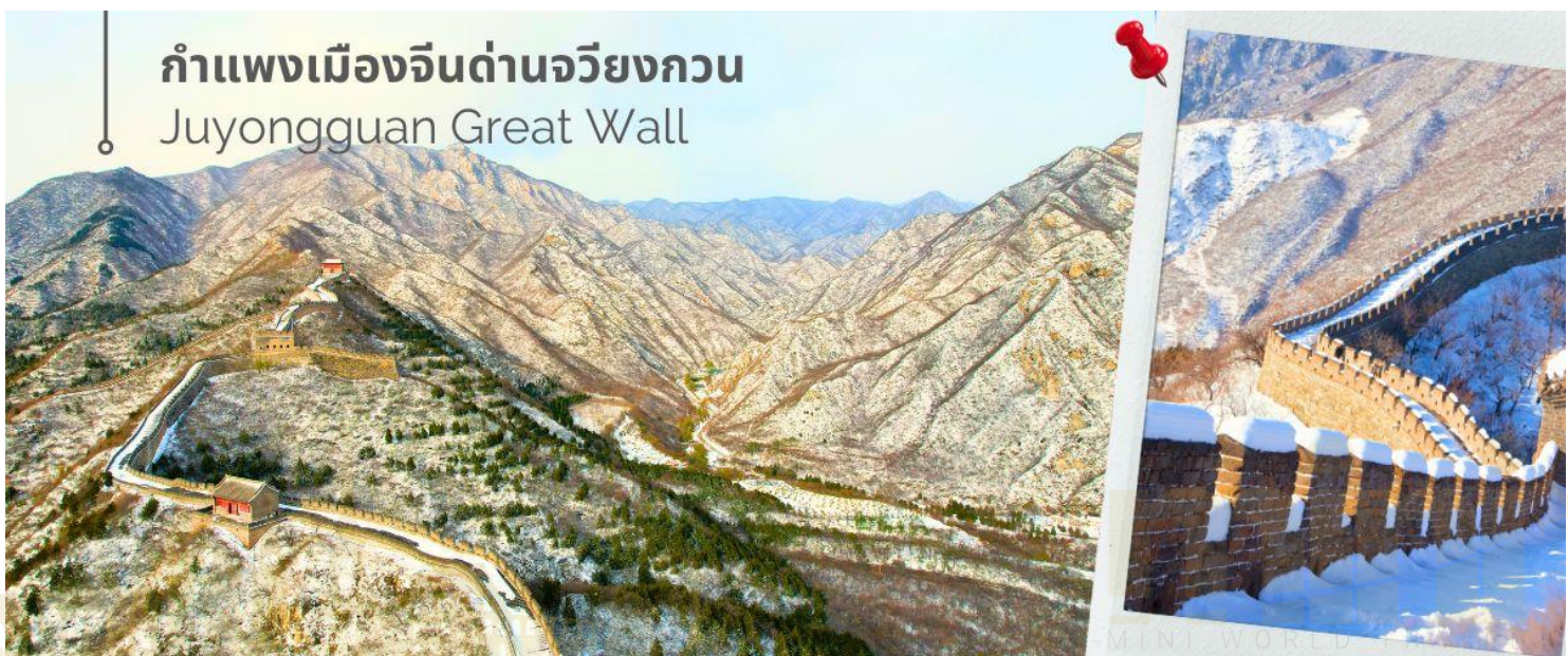
กำแพงเมืองจีนด่านจวิรงกวน Juyongguan Great Wall

แวะชมสินค้าร้านบัวหิมะ (ร้านรัฐบาลจีน) จากนั้นนำท่านเดินทางชมความยิ่งใหญ่ของ กำแพงเมืองจีนด่านจวิรงกวน (Juyongguan Great Wall) หรือที่รู้จักกันในชื่อ ป้อมจวิรงกวน เป็นด่านที่ใกล้กับใจกลางกรุงปักกิ่งมากที่สุด ราว 50 กิโลเมตร เท่านั้น นับเป็นหนึ่งในด่านสำคัญและเป็นสัญลักษณ์ของกำแพงเมืองจีน มีความยาวราว 4 กิโลเมตร ตั้งอยู่ทางทิศตะวันตกเฉียงเหนือของกรุงปักกิ่ง สร้างขึ้นในสมัย จีนซีฮ่องเต้ กำแพงนี้ตั้งอยู่ในหุบเขา Guangou ทำให้มีชื่อได้เปรียบโดยธรรมชาติคือสามารถ "ยึดครองได้ง่าย แต่โจมตีได้ยาก" ถือเป็นหนึ่งในจุดเริ่มต้นของกำแพงเมืองจีนในภาคเหนือ ซึ่งสร้างขึ้นเพื่อป้องกันกรุงปักกิ่งการรุกรานจากชนเผ่าเร่ร่อน ด่านจวิรงกวนมีสถาปัตยกรรมที่สวยงามของศิลปะจีน จากยอดด่าน สามารถมองเห็นทิวทัศน์ที่สวยงามของเทือกเขาและธรรมชาติโดยรอบ นับว่าเป็น 1 ใน 8 จุดชมวิวที่มีชื่อเสียงของปักกิ่งมาตั้งแต่สมัยราชวงศ์จิ้น จากนั้นนำท่านแวะชมสินค้าร้านหมอนยางพารา