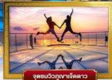
จุดชมวิวกูเงาเจ็ดดาว