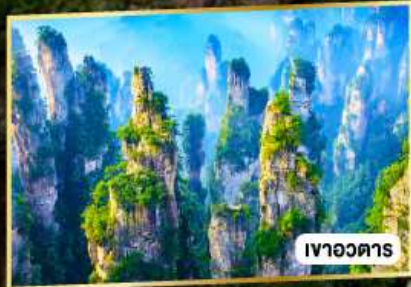
เขาวงคาร