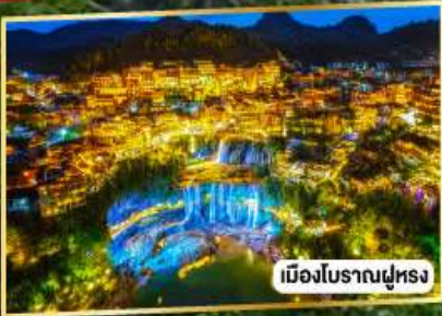
เมืองโบราณฝูหลง

เฟิ่งหวง ฝูหลงเจิ้น มนตร์งลิ่งแห่งขุนเขา และเมืองโบราณ 5 วัน 4 คืน