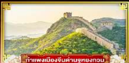
กำแพงเมืองจีนด้านอุทยานกวน

“ตะลุยสวนสนุกยูนิเวอร์แซล” ชมสิ่งมหัศจรรย์ของโลกกำแพงเมืองจีน