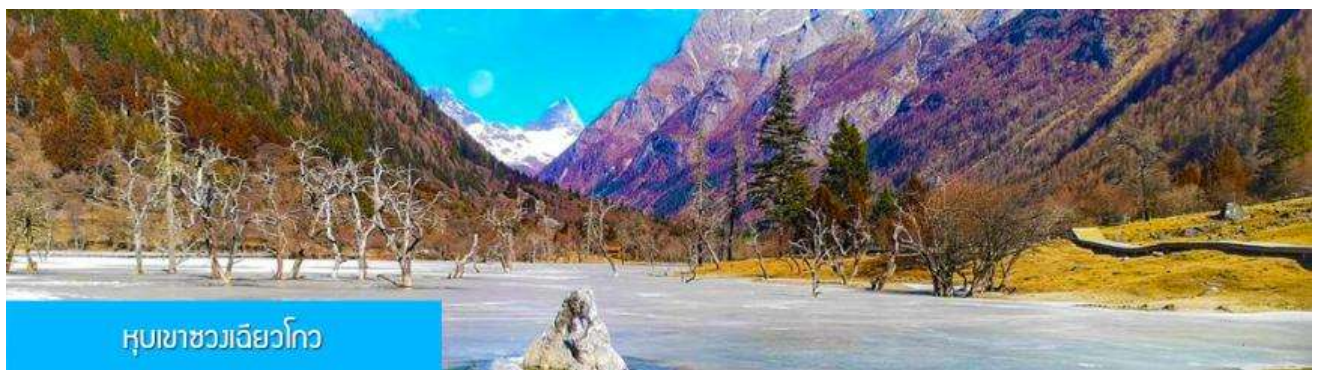
หุบเขาซวงเจียวโกว

นำท่านเที่ยวชม หุบเขาซวงเจียวโกว 双桥沟景区 ที่เป็นแหล่งท่องเที่ยวที่สวยงามที่สุดแห่งหนึ่งในเขตอุทยานภูเขาสี่ดรุณี นำท่านนั่งรถบัสของอุทยานที่วิ่งไปผ่านเส้นทางที่สร้างคู่ขนานกับลำธารภายในหุบเขา ท่านจะได้สัมผัสกับความสวยงามของทัศนียภาพธรรมชาติที่หาชมได้ยาก โดยมีภูเขาหิมะสูงตระหง่านอยู่เบื้องหลัง ธารน้ำใสไหลริน และสระน้ำที่มีสีเขียวมรกต ในฤดูใบไม้ผลิและฤดูร้อนท่านจะได้เห็นฝูงจามรีท่ามกลางทุ่งหญ้าเขียวขจี ส่วนในฤดูหนาวทุ่งหญ้าและพื้นดินจะปกคลุมด้วยพรมหิมะสีขาว.. รถบัสของอุทยาน