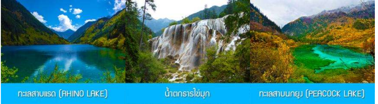
ทะเลสาบแรด (RHINO LAKE)

หลังอาหารเช้า นำท่านเดินทางสู่เช้า อุทยานแห่งชาติจิวจ้ายโกว 九寨沟景区 ตั้งอยู่ด้านทิศเหนือของมณฑลเสฉวน ซึ่งเป็นส่วนหนึ่งในบริเวณตอนใต้ของเทือกเขาหิมิงซาน ห่างออกไปจากตัวเมืองเฉิงตูราว 500 กิโลเมตร จิวจ้ายโกวมีชื่อเสียงด้านความงามแห่งสีสันที่แปลกเปลี่ยนไม่รู้จบ ทะเลสาบผุดขึ้นท่ามกลางหมู่แมกไม้เขียวจี น้ำใสเป็นประกายชุ่มฉ่ำ ยอดเขาหิมะตัดกับท้องฟ้าสีคราม เกิดเป็นภาพธรรมชาติอันงดงามที่แปรเปลี่ยนไปตามฤดูกาลผลิ ด้วยความสวยงามจึงทำให้อุทยานแห่งชาติจิวจ้ายโกว ได้ถูกขึ้นทะเบียนเป็นมรดกโลกทางธรรมชาติ ในปีค.ศ. 1992