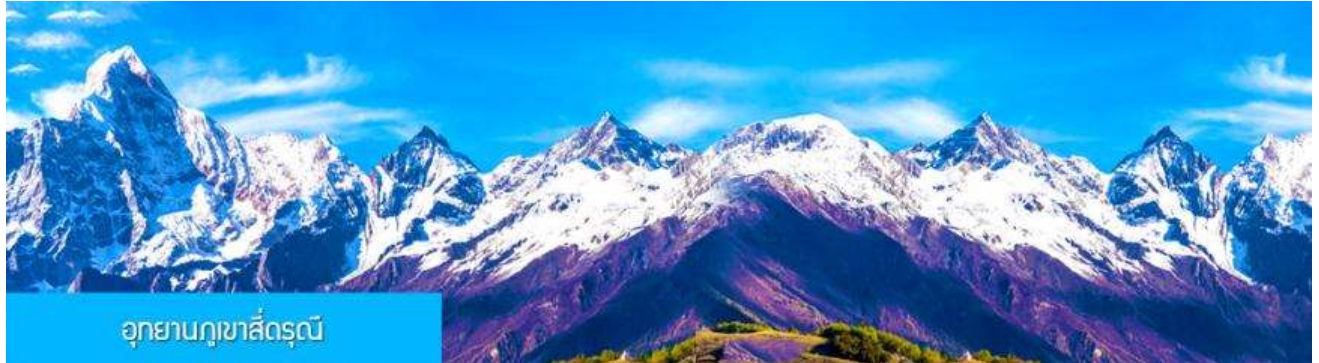
อุทยานภูเขาสี่ดรุณี

เมืองเฉิงตูเป็นเมืองเอกของมณฑลเสฉวน เป็นหนึ่งในมหานครที่มีประชากรมากที่สุดของจีน เป็นเมืองประวัติศาสตร์เก่าแก่ และเป็นศูนย์กลางการเมืองการปกครอง การศึกษาและการคมนาคมขนส่ง เป็นแหล่งกำเนิดของหมี่แพนด้า และเป็นประตูสู่แหล่งท่องเที่ยวระดับโลก จากนั้นนำท่านเข้าสู่ที่พักโรงแรม พักที่ Holidays inn express หรือ โรงแรมระดับเดียวกัน โรงแรมระดับ 4 ดาวท้องถิ่นหรือเทียบเท่า