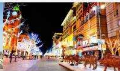
ถนนหวังฝูจิ้ง

*ทางบริษัทฯ ขอสงวนสิทธิ์ในการสลับโปรแกรมทัวร์ตามความเหมาะสมขึ้นอยู่กับสถานการณ์บ้านงาน โดยคำนึงถึงผลประโยชน์ของลูกค้าเป็นสำคัญ