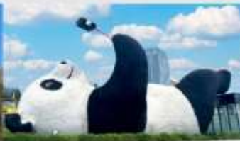
รูปปั้นหมีแพนด้าอนเซลฟี