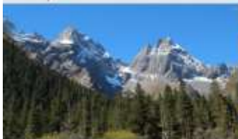
ภูเขาสี่ดรุณี (หุบเขาชวงเฉียวโกว)