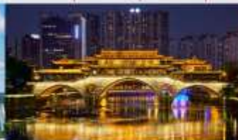
สะพานอันชุน