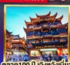
ตลาด 100 ปี เติ้งหวงเมี่ยว