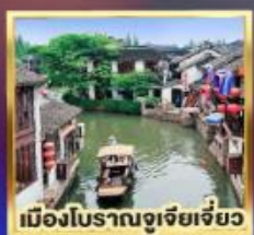
เมืองโบราณซูเจียเจียว