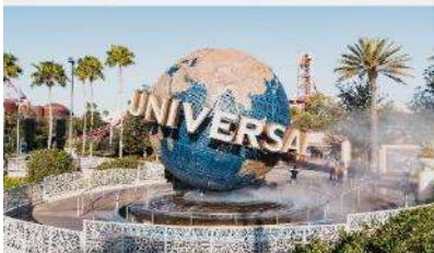
สวนสนุกยูนิเวอร์สัลปักกิ่งสุดดีไอ