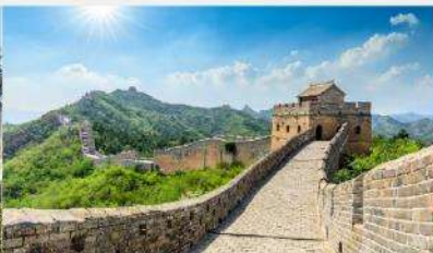
ท่าแพงเมืองจีน