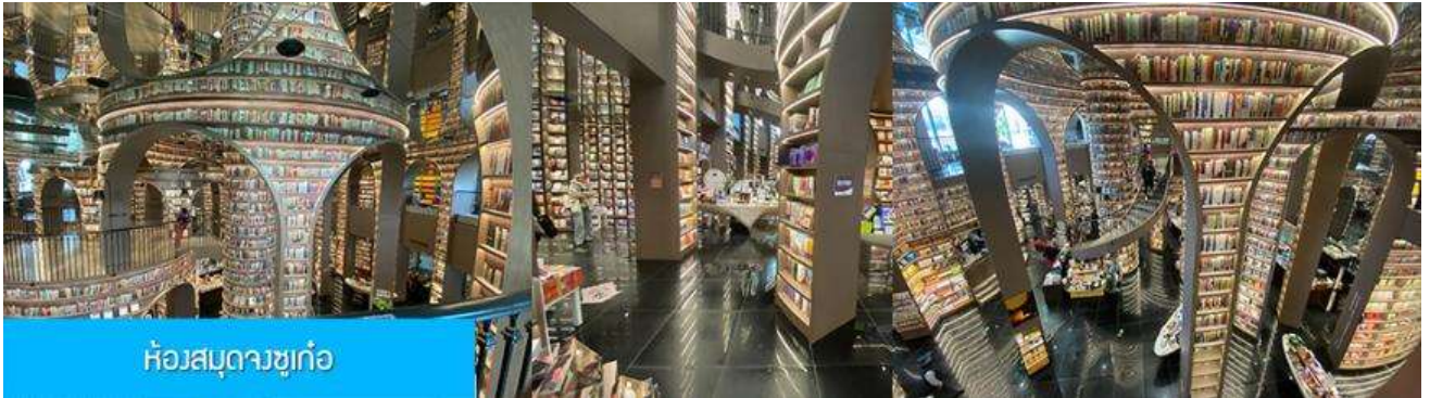
ห้องสมุดจวงชู่เก๋อ

หลังอาหารนำท่านชม สะพานหนานเฉียว 南桥 สะพานโบราณพร้อมแม่น้ำตู่เจียงเย็นขึ้นชื่อที่ได้กลายเป็นแหล่งท่องเที่ยวสำคัญและจุดเช็คอินสำหรับนักท่องเที่ยว ในช่วงค่ำที่นี้จะประดับประดาด้วยแสงสี บริเวณริมน้ำจะถูกประดับด้วยแสงไฟสีฟ้าที่ทอดยาวไปตามแนวแม่น้ำ ชาวบ้านตั้งชื่อว่าเป็น น้ำตาสีฟ้า 蓝色眼泪 พักที่ โรงแรม CENTER INTER HOTEL ระดับ 4 ดาวห้องดีนหรือเทียบเท่าในเมืองตู่เจียงเย็น