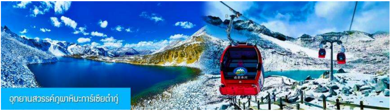
อุทยานสวรรค์ภูผาหิมะการ์เซียต้าถู่