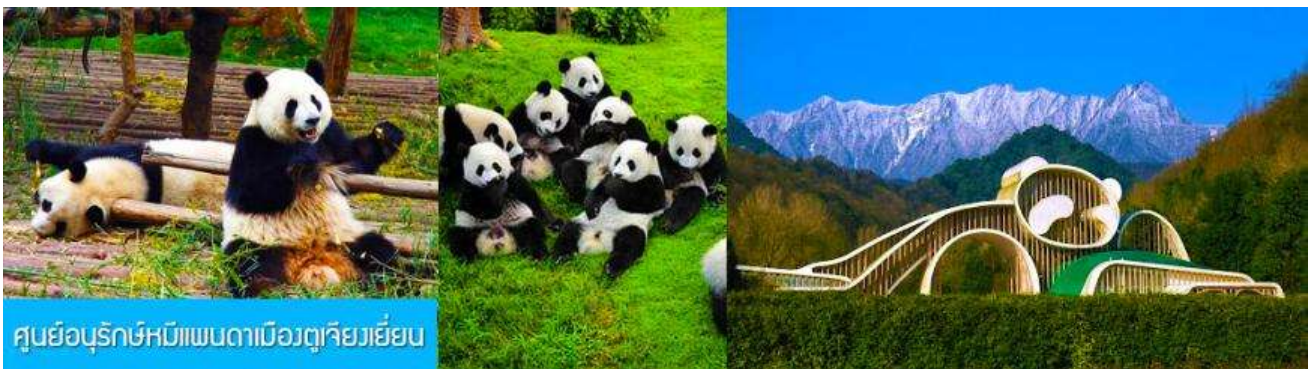
ศูนย์อนุรักษ์หมีแพนดาเมืองตู่เจียงเย็น