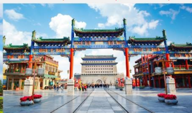
ถนนโบราณเจียนเหมิน