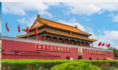
จัตุรัสเทียนอันเหมิน