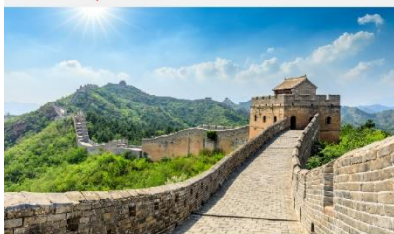
กำแพงเมืองจีน