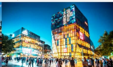
ย่านซุนหลี่ถุน

*ทางบริษัทฯ ขอสงวนสิทธิ์ในการสลับโปรแกรมทัวร์ตามความเหมาะสมขึ้นอยู่กับสถานการณ์หน้างาน โดยคำนึงถึงผลประโยชน์ของลูกค้าเป็นสำคัญ