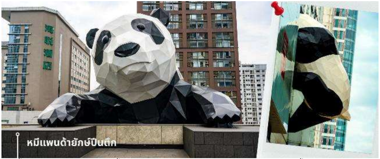
หมีแพนด้ายักษ์ปักกิ่ง

จากนั้นให้ท่านให้อิสระกับการเลือกซื้อสินค้าของฝากที่ ถนนไท่กุ่หลี่ และ ถนนชุนซีลู่ ในย่านนี้เป็นถนนโบราณ ในอดีตเคยโรงงานผลิตผ้าไหมใหญ่ที่สุดในจีน ปัจจุบันได้เปลี่ยนเป็นถนนช้อปปิ้งแหล่งสวรรค์ของนักท่องเที่ยว เป็นถนนคนเดิน มีห้างสรรพสินค้าชื่อดัง มีร้านค้ามากกว่า 700 ร้านค้าที่เต็มไปด้วยสินค้าต่าง ๆ ทั้งร้านค้าแฟชั่น ร้านอาหารและโรงแรมนานาชาติมากมายซึ่งเป็นที่ยอดนิยมที่มีการเชื่อมต่อทางวัฒนธรรมท้องถิ่นที่เป็นแหล่งช้อปปิ้งและเป็นแหล่งร้านอาหารที่อร่อยต่าง ๆ มากมาย ซึ่งเป็นสถานที่เที่ยวของเฉิงตูที่ทำให้เพลิดเพลินกับสินค้าแบรนด์เนมและแบรนด์จีน เพื่อให้นักท่องเที่ยวได้เลือกซื้อตามอิสระ แวะร้าน POP MART