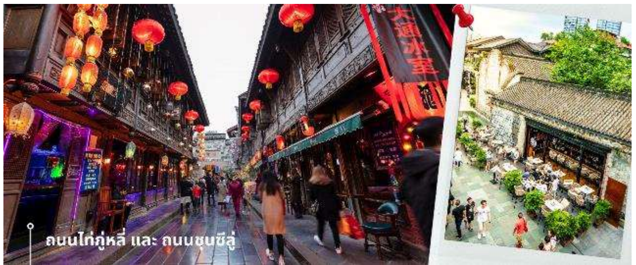
ถนนไท่กุ่หลี่ และ ถนนชุนซีลู่

จากนั้นให้ท่านให้อิสระกับการเลือกซื้อสินค้าของฝากที่ ถนนไท่กุ่หลี่ และ ถนนชุนซีลู่ ในย่านนี้เป็นถนนโบราณ ในอดีตเคยโรงงานผลิตผ้าไหมใหญ่ที่สุดในจีน ปัจจุบันได้เปลี่ยนเป็นถนนช้อปปิ้งแหล่งสวรรค์ของนักท่องเที่ยว เป็นถนนคนเดิน มีห้างสรรพสินค้าชื่อดัง มีร้านค้ามากกว่า 700 ร้านค้าที่เต็มไปด้วยสินค้าต่าง ๆ ทั้งร้านค้าแฟชั่น ร้านอาหารและโรงแรมนานาชาติมากมายซึ่งเป็นที่ยอดนิยมที่มีการเชื่อมต่อทางวัฒนธรรมท้องถิ่นที่เป็นแหล่งช้อปปิ้งและเป็นแหล่งร้านอาหารที่อร่อยต่าง ๆ มากมาย ซึ่งเป็นสถานที่เที่ยวของเฉิงตูที่ทำให้เพลิดเพลินกับสินค้าแบรนด์เนมและแบรนด์จีน เพื่อให้นักท่องเที่ยวได้เลือกซื้อตามอิสระ แวะร้าน POP MART