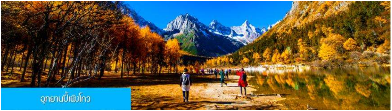
อุทยานปีเพิงโกว