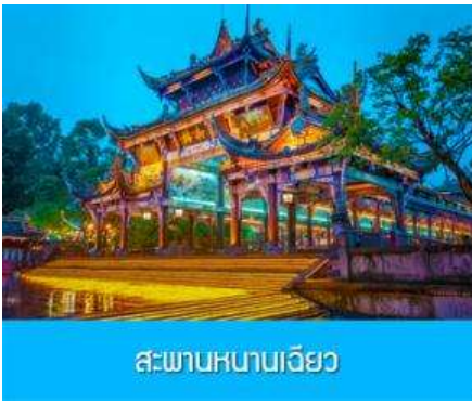
สะพานหนานเจียว