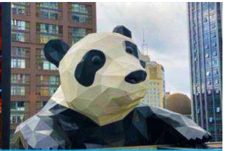
หมีแพนด้าปิ่นตึก ณ ตึก IFS

วันที่หก เมืองเอ๋อเหมยซาน-เมืองเฉิงตู- ถนนไท่กู่หลี่-วัดต้าฉือ-ถนนชุนซีลู่-ตึก IFS แพนด้าปิ่นตึก - กรุงเทพฯ สยามบิณสูวรรณภูมิ