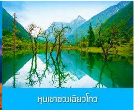
หุบเขาชวงเฉียวโกว