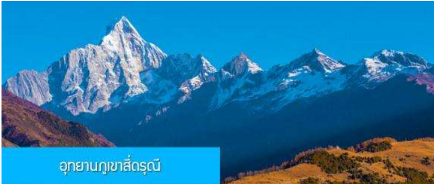
อุทยานภูเขาสี่ครุณี

พักที่ HOLIDAY INN EXPRESS HOTEL โรงแรมระดับ 4 ดาวท้องถิ่น หรือเทียบเท่า ย่านสนามบินเทียนฝู