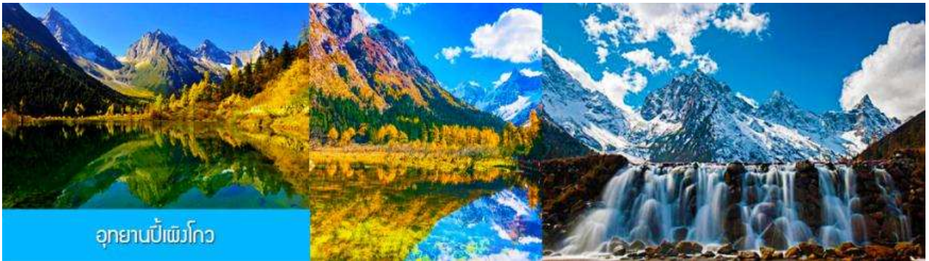
อุทยานปีเพิงโกว

(เนื่องจากถนนสายนี้เป็นถนนสองเลนที่ให้รถวิ่งสวนได้ ในช่วงเทศกาลอาจมีการจราจรที่คับคั่ง เนื่องจากมีนักท่องเที่ยวชาวจีนนิยมขับรถผ่านและแวะจอดข้างทางจนทำให้การจราจรติด หรือ ถนนถูกปิดเพราะเกิดจากดินสไลด์จันทรไม่สามารถสัญจรไปมาได้ ทางทัวร์สงวนสิทธิ์ในการปรับเปลี่ยนเส้นทางเดินรถ)