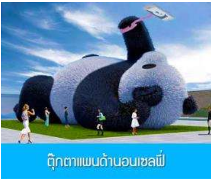
ตุ๊กตาแพนด้าบนเซลฟี

หลังอาหารนำท่านชม สะพานหนานเจียว 南桥 สะพาน โบราณคร่อมแม่น้ำตูเจียงเขียนจีนชื่อที่ได้กลายเป็น แหล่งท่องเที่ยวที่สำคัญและจุดเช็คอินสำหรับนักท่องเที่ยว ในช่วงค่ำที่นี่จะประดับประดาด้วยแสงสี บริเวณริม แม่น้ำจะถูกประดับด้วยแสงไฟสีฟ้าที่ทอดยาวไปตามแนวแม่น้ำ ชาวบ้านตั้งชื่อว่าเป็น น้ำตาสีฟ้า 蓝色眼泪 พักที่ โรงแรม CENTER INTER HOTEL ระดับ 4 ดาวท้องถิ่นหรือเทียบเท่าในเมืองตูเจียงเขียน