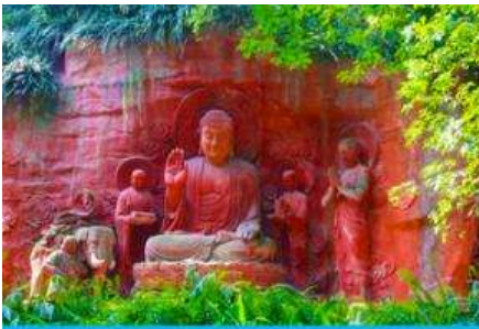
วัดเป้ากั๋ว