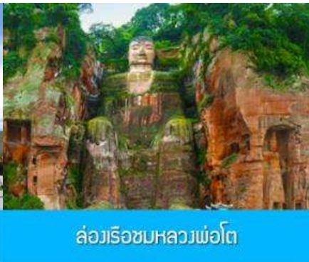
ล่องเรือชมหลวงพ่อดำ