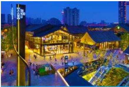
ถนนไท่กู่หลี่ และวัดต้าฉือ

พักที่ โรงแรม ORANGE TREE HOTEL ระดับ 4 ดาวห้องถื่นหรือเทียบเท่าในเมืองเอ๋อเหมยซาน