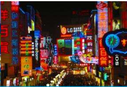
ถนนคนเดินชุนซีลู่