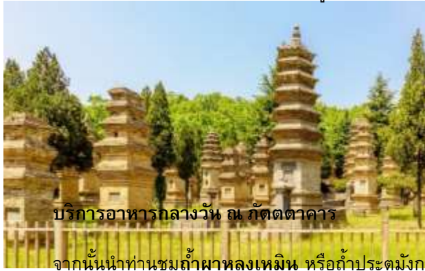
บริการอาหารกลางวัน ณ ภัตตาคาร