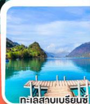
ทะเลสาบเบเรียนซ์