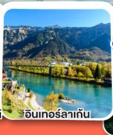
อินเทอร์ลาเก้น