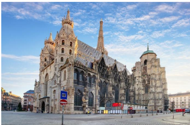
คู่มือเมืองของประเทศออสเตรีย

จากนั้นนำท่านเดินทางสู่ กรุงเวียนนา (Vienna) (ใช้เวลาเดินทางประมาณ 2 ชั่วโมง 10 นาที) เมืองหลวงของ