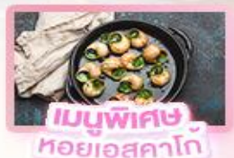
เมนูพิเศษ หอยออสตาโก้

เยอรมัน เนเธอร์แลนด์ เบลเยียม ฝรั่งเศส Keukenhof