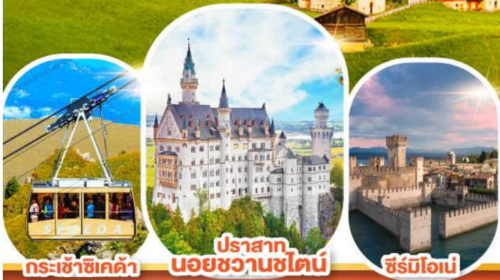
กระเช้าซิคเคต้า