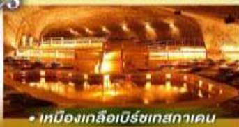
• เมืองเกลือบิรชเทสกาเดน