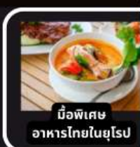
มือพิเศษ อาหารไทยในยุโรป