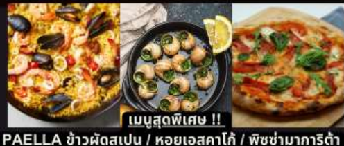
PAELLA ข้าวผัดสเปน / หอยแอสคาโก้ / พืชข่ามาการ์ต้า