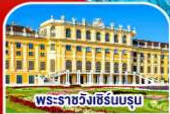
พระราชวังเซรินบรุณ