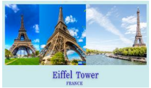
Eiffel Tower FRANCE

วันที่สามของการเดินทาง เข้าชมพระราชวังแวร์ซายส์-พิพิธภัณฑ์ลูฟวร์-ปารีส ฝรั่งเศส B-L-D