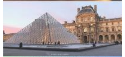
LOUVRE MUSEUM พิพิธภัณฑ์ลูฟวร์