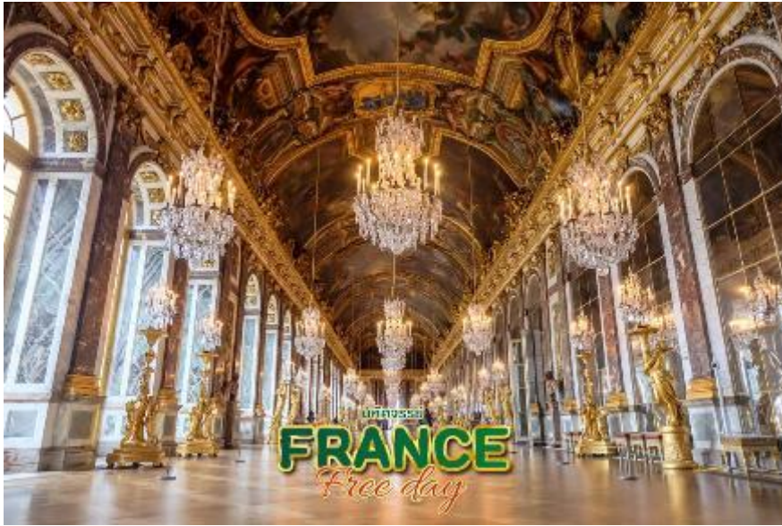
กับชาติยุโรปในประเทศไทย

MUST DO ห้องกระจก แห่งแวร์ซายเป็นอีกหนึ่งหน้า ประวัติศาสตร์ของไทยครั้งสมเด็จพระ นารายณ์มหาราชทรงส่ง คณะทูตไปเจริญสัมพันธไมตรีกับ พระเจ้าหลุยส์ที่ 14 นำโดยออก พระวิสุทธิสุนทร ในวันที่ 1 กันยายนปี พ.ศ. 2229 (1686)นับเป็นการส่งคณะทูต สำเร็จอย่างเป็นทางการครั้งแรก