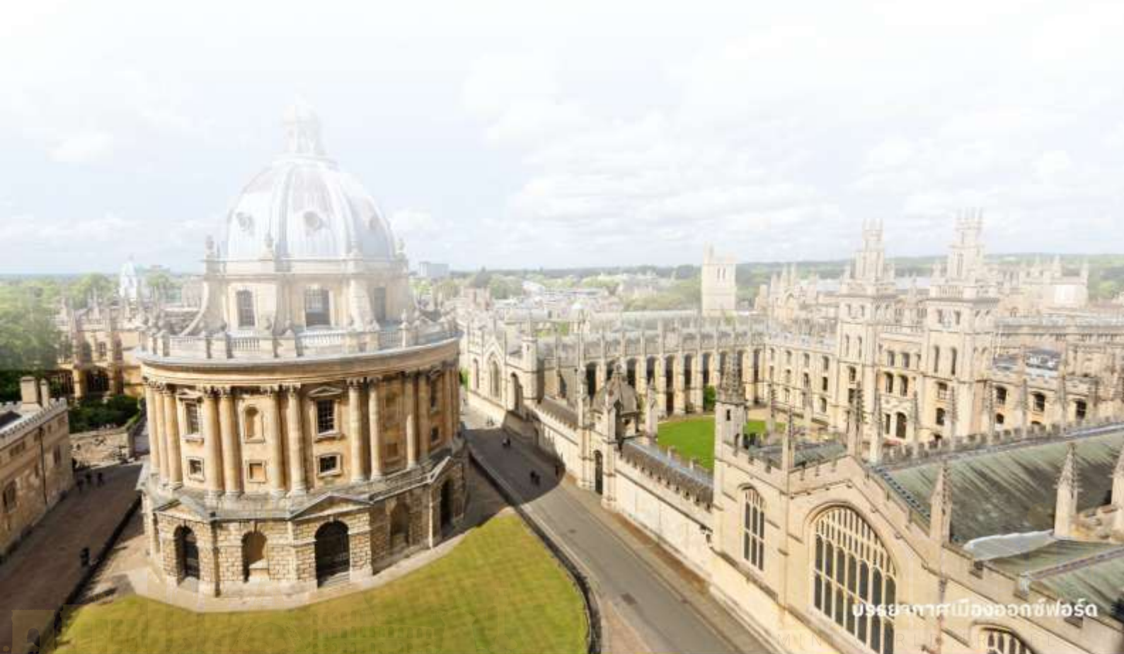
บรรยากาศเมืองออกซ์ฟอร์ด

จากนั้นนำท่านเดินทางไปยัง พระราชวังเบลนนิม ในมณฑลออกฟอร์ดเชอร์ ที่นี่เป็นที่เกิดของ เซอร์วินสตัน เชอร์ชิลล์ ผู้นำอังกฤษในสมัยสงครามโลกครั้งที่ 2 และเป็นพระราชวังสไตล์บารอกที่งดงามที่สุดในอังกฤษ Blenheim Palace นั้นเป็นวังเดียวในอังกฤษที่เจ้าของไม่ได้เป็นเชื้อพระวงศ์ แต่วังแห่งนี้เป็นที่พำนักอาศัยหลักของ Dukes of Marlborough และภายหลังได้รับการยกย่องเป็น World Heritage Site โดย UNESCO ในปี ค.ศ. 1987 อิสระให้ท่านถ่ายภาพพระราชวังจากด้านนอกตามอัธยาศัย