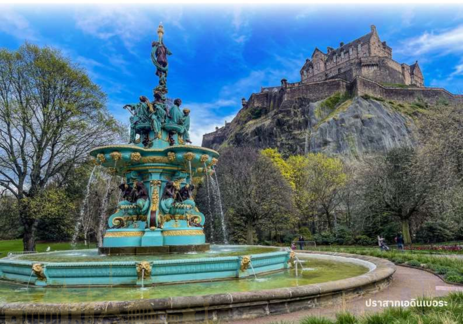
ปราสาทเอดินเบอระ

ผังตรงข้ามเป็นรัฐสภาแห่งชาติสกอตอันน่าทึ่งด้วยสถาปัตยกรรมร่วมสมัย