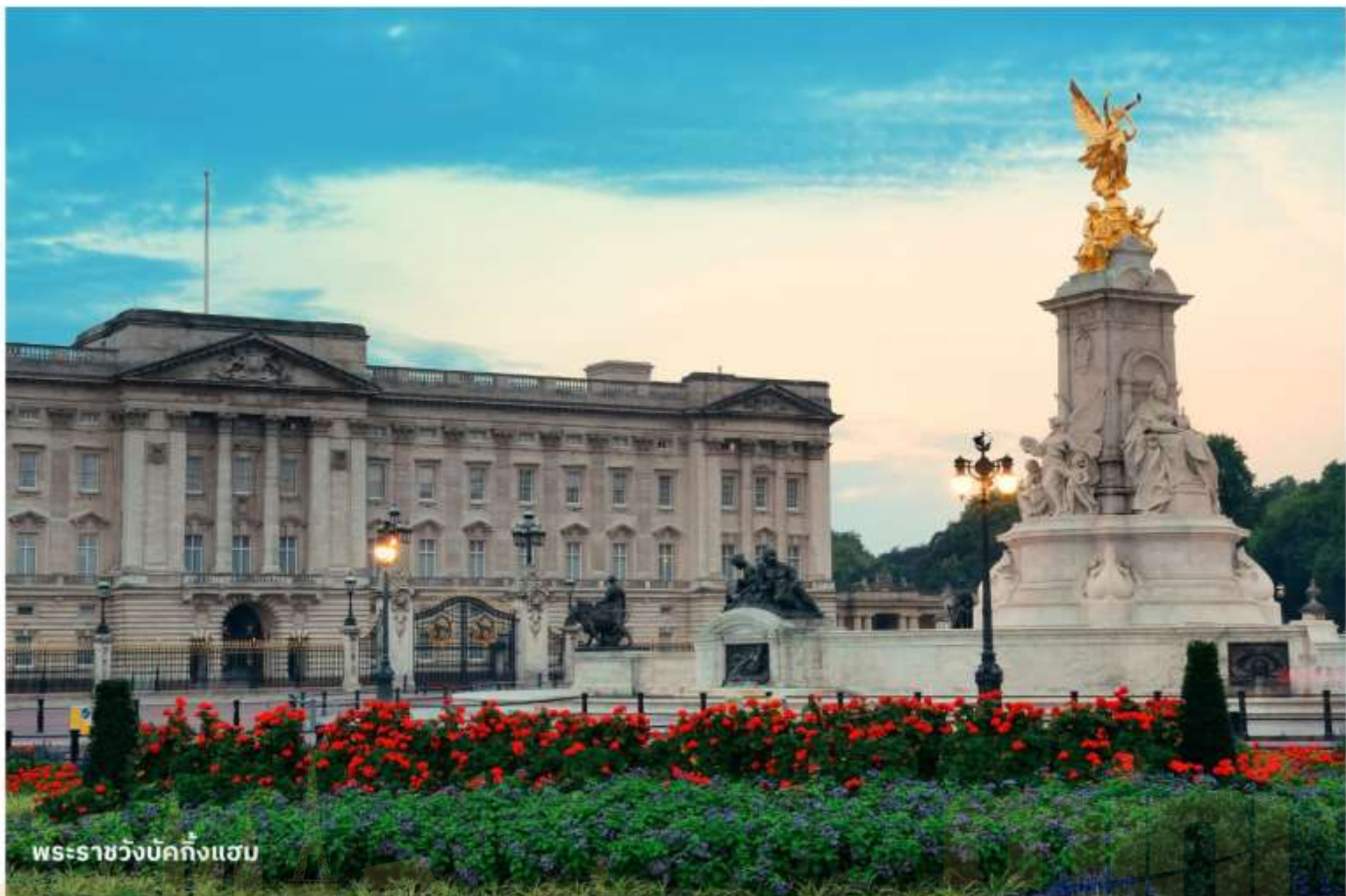
พระราชวังบักกิงแฮม

ได้เวลาอันสมควรนำท่านสู่สนามบิน เพื่อเตรียมตัวเดินทางกลับประเทศไทย