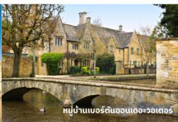
หมู่บ้านเบอร์ตันออนเดอะวอเตอร์