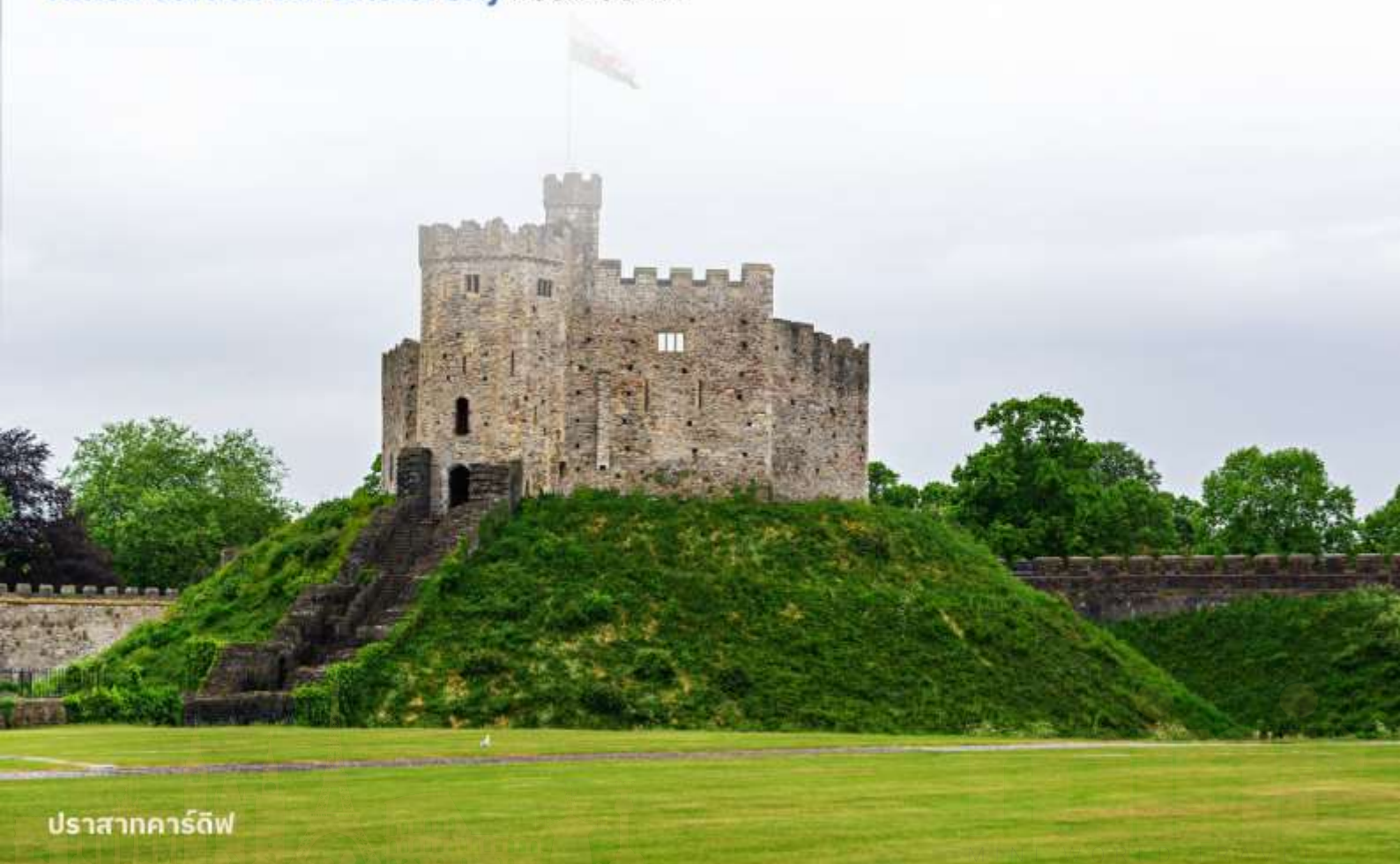
ปราสาทคาร์ดิฟฟ์

บริการอาหารค่ำ ณ ภัตตาคาร นำท่านเข้าสู่ที่พัก Hilton Garden Inn Bristol City หรือเทียบเท่า