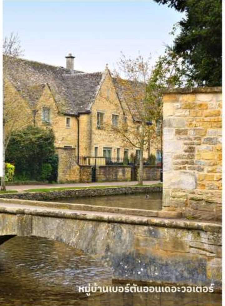
หมู่บ้านเบอร์ตันออนเดอะวอเตอร์

จากนั้นนำท่านเดินทางสู่ เขตคอตส์วอลส์ เขตหมู่บ้านชนบทแสนสวยของอังกฤษถึง 70 หมู่บ้าน ใช้เวลาเดินทางประมาณ 3.30 ชั่วโมง นำท่านเที่ยวชม หมู่บ้านเบอร์ตันออนเดอะวอเตอร์ ( Bourton On The Water ) หมู่บ้านเล็ก ๆ ที่รู้จักกันในนามของ “เวนิส แห่งคอตวอลส์” เมืองที่โด่งดังที่สุดในคอตส์วอลส์ ดูเจียบสงบบมีลำธารสายเล็ก ๆ (แม่น้ำวินด์ริช) ไหลผ่านกลางเมือง และมีสะพานหินทอดข้ามน้ำเป็นช่วง ๆ กับต้นวิลโลว์ที่แกว่งกิ่งก้านใบอยู่ริมน้ำ