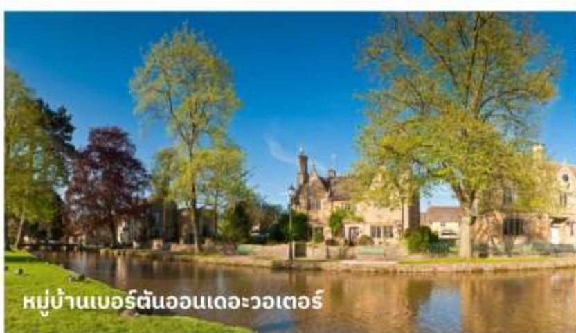
หมู่บ้านเบอร์ตันออนเดอะวอเตอร์