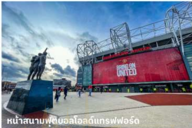
หน้าสนามฟุตบอลโอลด์แทรฟฟอร์ด