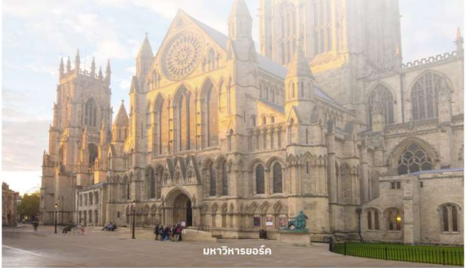
มหาวิหารยอร์ก

จากนั้นนำท่านเดินทางต่อไปที่ The Shambles (เดอะแซมเบิล) เป็นสถานที่ที่มีความคล้ายกับตรอกไดอากอนในภาพยนตร์ชื่อดังอย่าง Harry Potter อีระให้ท่านเดินเลือกซื้อของที่ระลึกตามอัธยาศัย