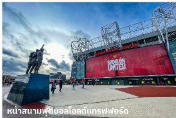
หน้าสนามฟุตบอลโอลด์แทรฟฟอร์ด