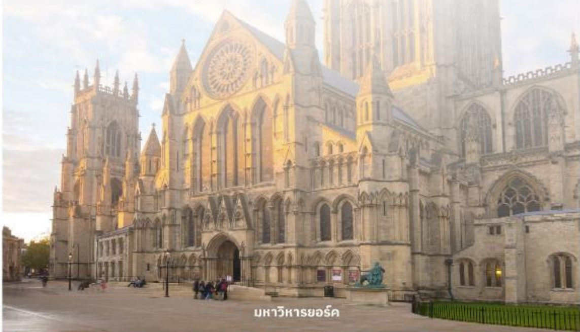
มหาวิหารยอร์ก

จากนั้นนำท่านเดินทางต่อไปที่ The Shambles (เดอะแซมเบิล) เป็นสถานที่ที่มีความคล้ายกับตรอกไดอากอนในภาพยนตร์ชื่อดังอย่าง Harry Potter อีระให้ท่านเดินเลือกซื้อของที่ระลึกตามอัธยาศัย