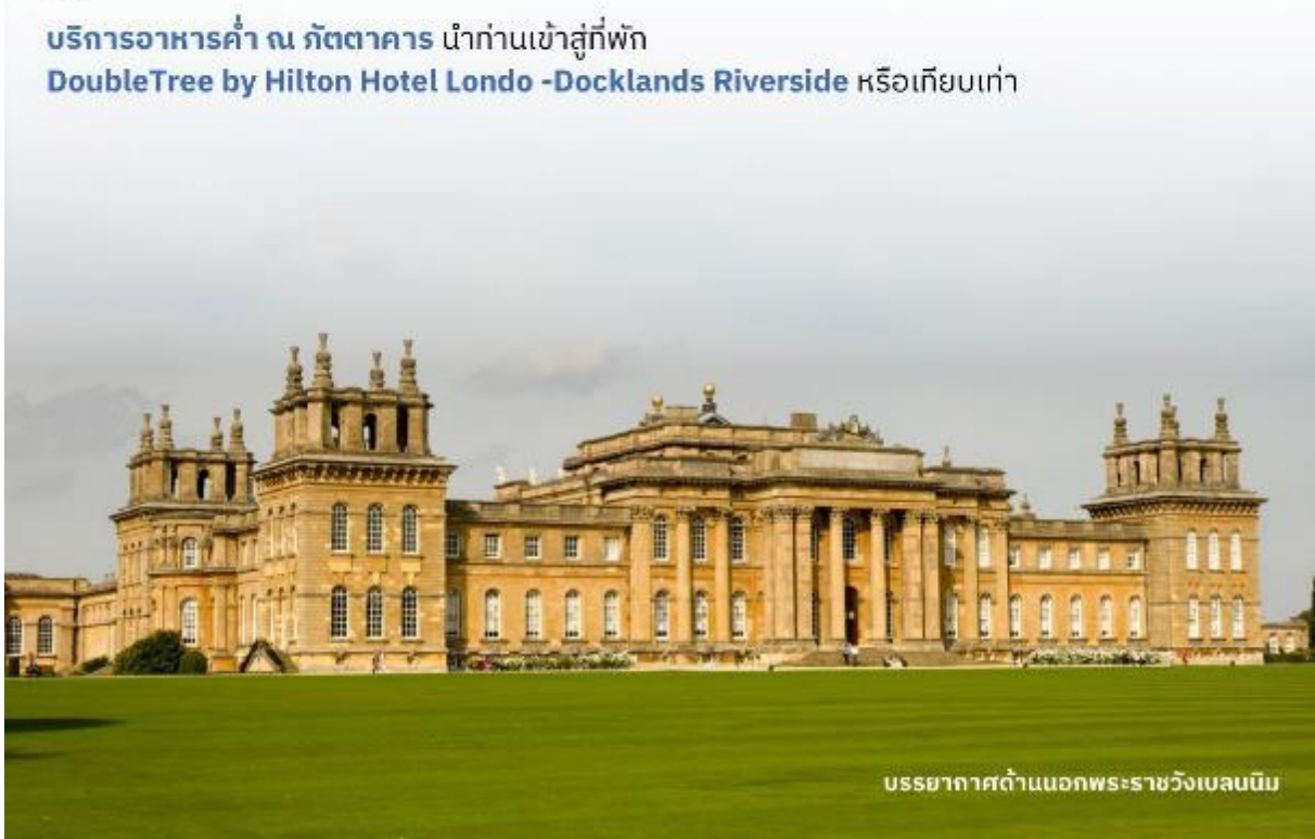
บรรยากาศด้านนอกพระราชวังเบลนนิม

DoubleTree by Hilton Hotel Londo -Docklands Riverside หรือเทียบเท่า