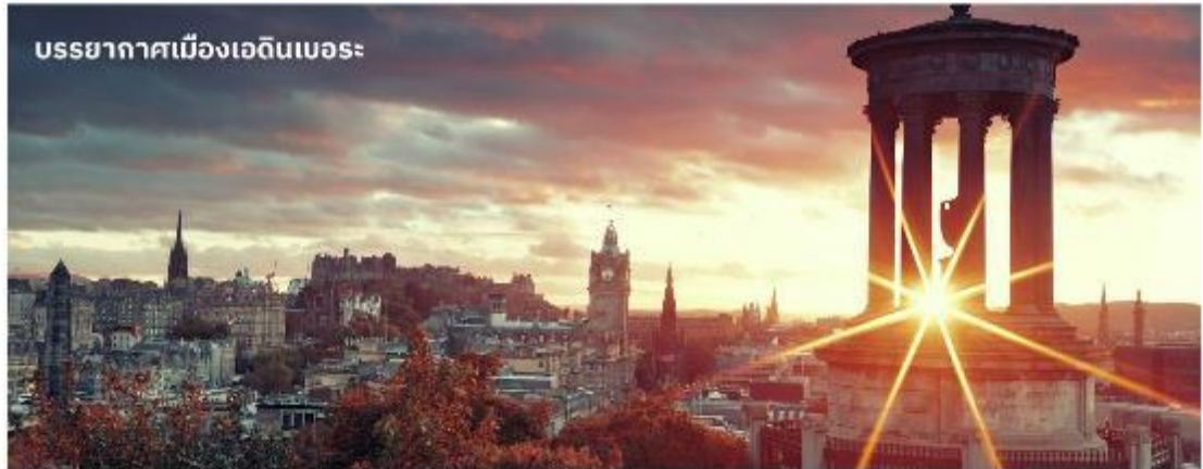
บรรยากาศเมืองเอ็ดินบะระ