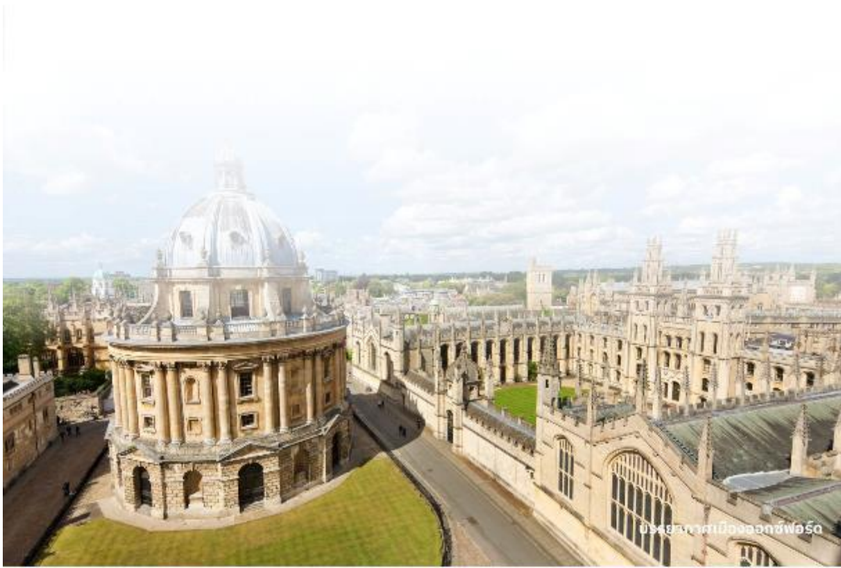
บรรยากาศเมืองออกซ์ฟอร์ด

จากนั้นนำท่านเดินทางไปยัง พระราชวังเบลนนิม ในมณฑลออกฟอร์ดเชียร์ ที่นี่เป็นที่เกิดของ เซอร์วินสตัน เชอร์ชิลล์ ผู้นำอังกฤษในสมัยสงครามโลกครั้งที่ 2 และเป็นพระราชวังสโตนบารอกที่งดงามที่สุดในอังกฤษ Blenheim Palace นั้นเป็นวังเดียวในอังกฤษที่เจ้าของไม่ได้เป็นเชื้อพระวงศ์ แต่วังแห่งนี้เป็นที่พำนักอาศัยหลักของ Dukes of Marlborough และภายหลังได้รับการยกย่องเป็น World Heritage Site โดย UNESCO ในปี ค.ศ. 1987 อิสระให้ท่านถ่ายภาพพระราชวังจากด้านนอกตามอัธยาศัย