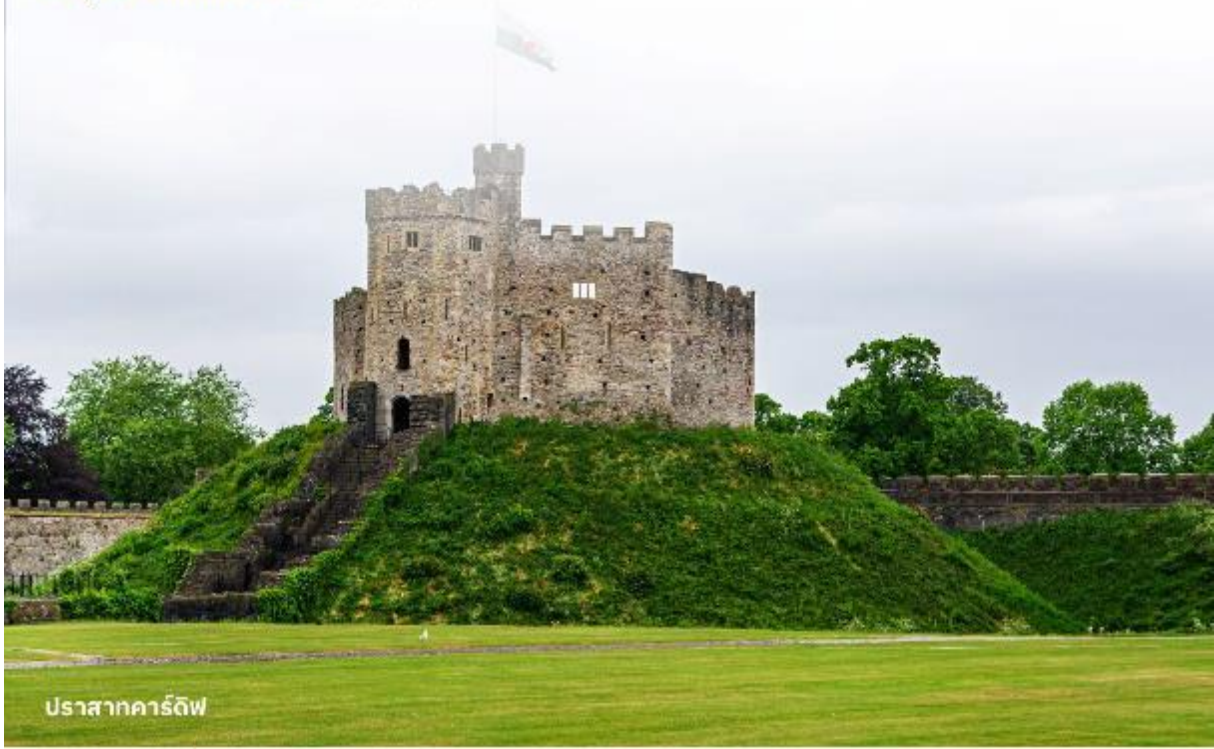
ปราสาทคาร์ดิฟฟ์

บริการอาหารค่ำ ณ ภัตตาคาร นำท่านเข้าสู่ที่พัก Clayton Hotel Cardiff หรือเทียบเท่า