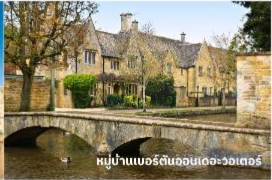
หมู่บ้านเบอร์ตันออนเดอะวอเตอร์