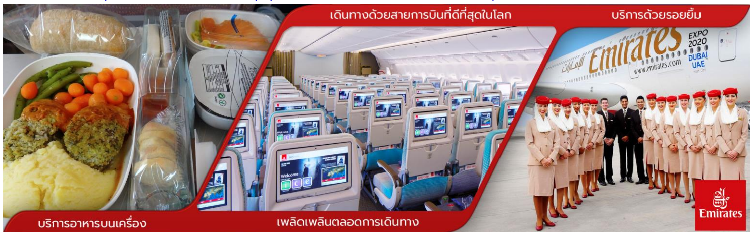
บริการอาหารบนเครื่อง

03.30 น. ✈️ ออกเดินทางสู่ สนามบิน BKK-DXB ท่าอากาศยานนานาชาติดูไบ โดยสายการบินเอมิเรตส์ EMIRATES EK เที่ยวบินที่ EK371 : 03.30-06.50 (ใช้เวลาเดินทาง 7 ชั่วโมง) (บริการอาหารและเครื่องดื่มบนเครื่อง)