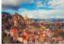
เมืองทบิลีซี

05.20 น. เดินทางถึงสนามบินอิสตันบูล แวะเปลี่ยนเครื่อง 06.55 น. ออกเดินทางสู่สนามบินทบิลีซี เที่ยวบิน TK378 09.45 น. เดินทางถึงสนามบินทบิลีซี ประเทศจอร์เจีย