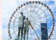
รูปปั้นอาลีและนีโน