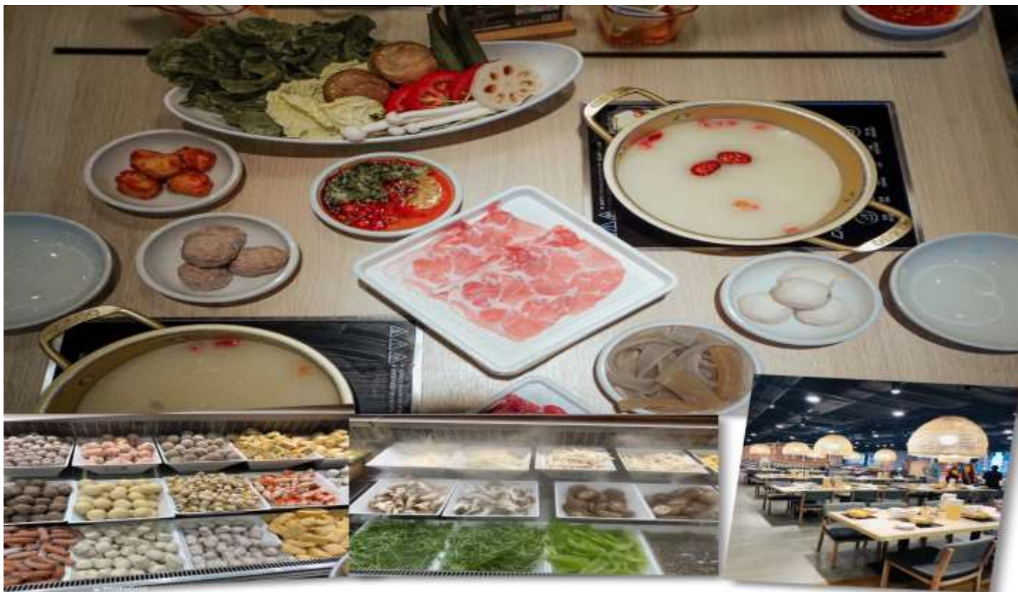
เที่ยง รับประทานอาหารเที่ยง ณ ภัตตาคาร (5) เมนูชาบู