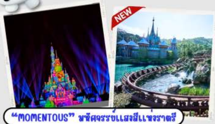
"MOMENTOUS" หนังสือนิทรรศการเสด็จเยือนราชินี