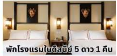
พักโรงแรมในดิสนีย์ 5 ดาว 1 คืน