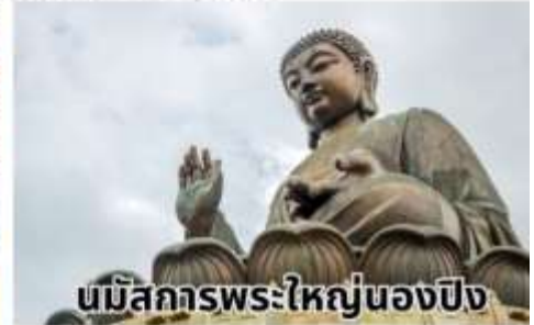
นมัสการพระใหญ่นองปิง