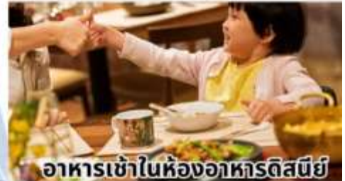
อาหารเช้าในห้องอาหารดิสนีย์