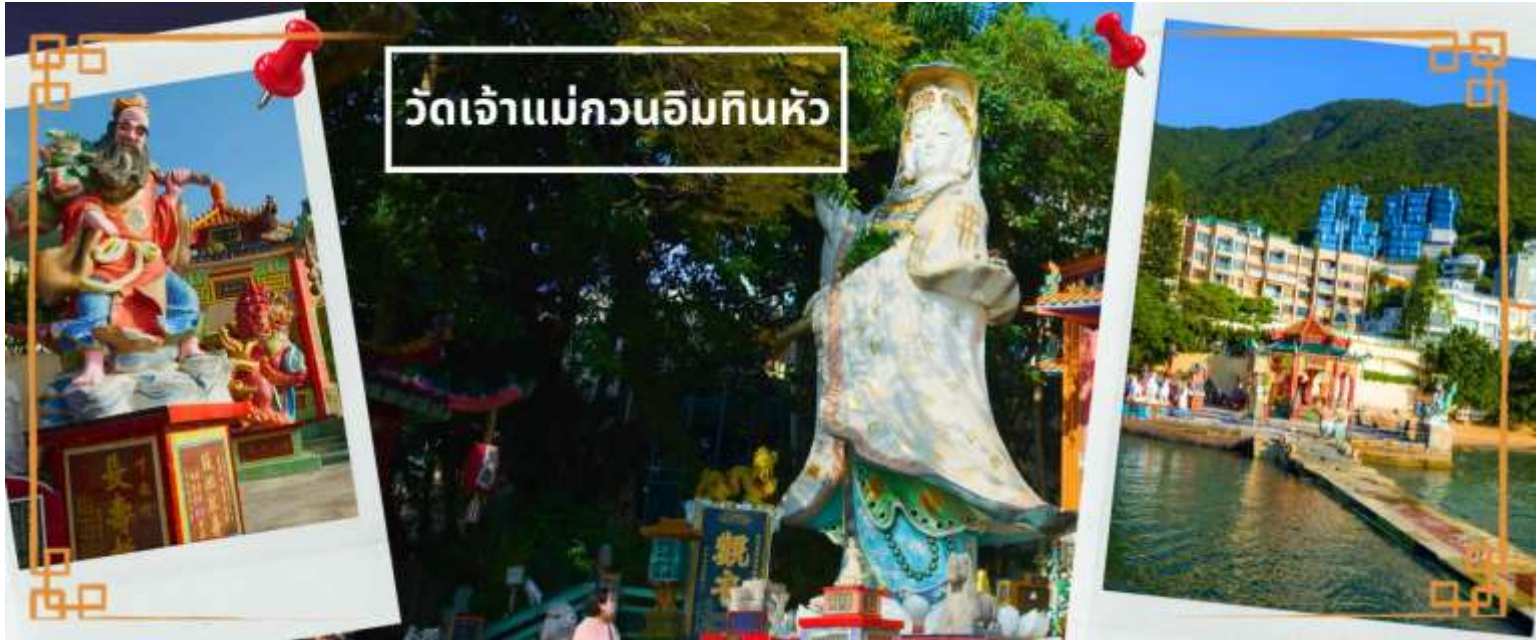
วัดเจ้าแม่กวนอิมกินหัว

ที่สุดของฮ่องกง บริเวณวัดจะมี เจ้าแม่กวนอิมองค์ใหญ่ ปางประทานพรตั้งอยู่ เป็นเทพที่ชาวฮ่องกงและคนจีนให้ความเคารพนับถือมากที่สุด สามารถขอพรได้ทุกเรื่อง วัดนี้เป็นที่นิยมมีนักท่องเที่ยวเดินทางมาขอพรกันมากมาย เพราะเชื่อในความศักดิ์สิทธิ์ และยังมี เจ้าแม่ทับทิม หรือเทพธิดาแห่งท้องทะเลองค์ใหญ่ ซึ่งคนฮ่องกง คนมาเก๊า และคนจีน ที่อยู่ริมทะเล ชาวประมง นักเดินเรือหรือผู้ที่เดินทางทางเรือเป็นประจำ จะนับถือเจ้าแม่ทับทิมเป็นอย่างมาก มีความเชื่อว่าเจ้าแม่ทับทิมจะปกป้องเราจากภัยอันตรายระหว่างการเดินทาง ภายในวัดยังมีเทพเจ้าและพระพุทธรูปต่างๆ ประดิษฐานไว้มากมายตามความเชื่อถือศรัทธา เช่น เทพเจ้าไฉชิงเอี้ย ไหว้ขอโชคลาภความมั่งคั่ง ความร่ำรวย, พระสังกัจจายน์โพธิสัตว์ เทพประทาน บุตร-ธิดา ไหว้อธิษฐานขอลูก, สะพานต่ออายุ (สะพานอายุยืน) สะพานสีแดงตั้งอยู่บนริมหาด สีแดงสด เชื่อกันว่า คนจีนเชื่อกันว่าหากเดินข้ามสะพานนี้ เราจะมีอายุยืนขึ้นอีก 3 วัน (3 วัน บนสวรรค์ = 3 ปี บนโลกมนุษย์) นั่นหมายความว่า ถ้าเราเดินข้ามสะพานนี้แล้ว จะมีอายุยืนยาวขึ้นอีก 3 ปี บนโลกมนุษย์, เทพเจ้าแห่งความรัก ไหว้ขอเนื้อคู่, ศาลา 8 เหลี่ยม เชื่อกันว่าเป็นจุดที่มีดวงจ्यूดีที่สุด ภายในศาลาแปดเหลี่ยม จุดกึ่งกลางของพื้นจะมีรูปแปดเหลี่ยม ให้เราไปยื่นขอพรจากตำแหน่งนี้เพื่อขอพรหลังจากสวรรค์ และ อีกมากมายให้ท่านได้สักการะบูชา