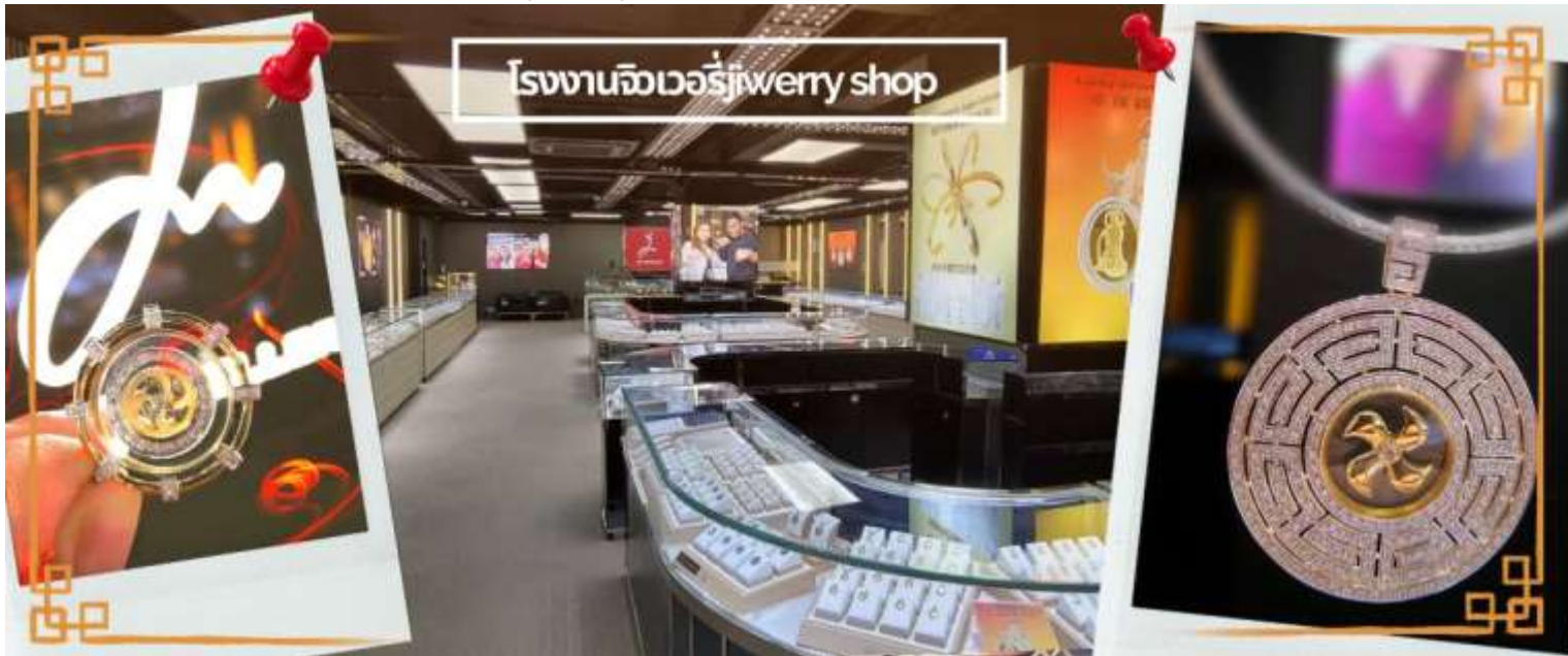
โรงงานจิวเวอรี่jewery shop

จากนั้นนำท่านชม โรงงานจิวเวอรี่ ซึ่งเป็นโรงงานที่มีชื่อเสียงที่สุดของฮ่องกงในเรื่องการออกแบบเครื่องประดับ อาทิเช่น จี้ และแหวนกั้งหัน ที่สวยงามโดดเด่นไม่เหมือนใคร ซึ่งถือกำเนิดขึ้นที่นี่และมีชื่อเสียงที่สุดใช้เป็นเครื่องประดับติดตัว และเสริมดวงชะตาสินค้าทุกชิ้นมีเอกสารรับประกันคุณภาพเปลี่ยน ซ่อม ได้ตลอดอายุการใช้งาน หากเกิดการชำรุดจากสินค้าไม่ใช่อุบัติเหตุ และนำท่านเลือกซื้อ เครื่องประดับที่ ร้านหยก ซึ่งคนจีนนั้นถือว่าหยกเป็นหิน ที่เป็นตัวแทนของความสวยงามและความบริสุทธิ์ มีความเชื่อว่าหยกมงคล ถ้าพกติดตัวไว้จะอายุยืนและสุขภาพดี