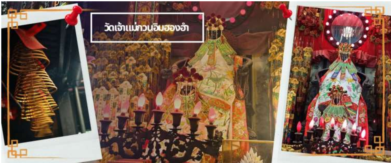
วัดเจ้าแม่กวนอิมของอ้า

จากนั้นนำท่านชม โรงงานจิวเวอรี่ ซึ่งเป็นโรงงานที่มีชื่อเสียงที่สุดของฮ่องกงในเรื่องการออกแบบเครื่องประดับ อาทิเช่น จี้ และแหวนกั้งหัน ที่สวยงามโดดเด่นไม่เหมือนใคร ซึ่งถือกำเนิดขึ้นที่นี่และมีชื่อเสียงที่สุดใช้เป็นเครื่องประดับติดตัว และเสริมดวงชะตาสินค้าทุกชิ้นมีเอกสารรับประกันคุณภาพเปลี่ยน ซ่อม ได้ตลอดอายุการใช้งาน หากเกิดการชำรุดจากสินค้าไม่ใช่อุบัติเหตุ และนำท่านเลือกซื้อ เครื่องประดับที่ ร้านหยก ซึ่งคนจีนนั้นถือว่าหยกเป็นหิน ที่เป็นตัวแทนของความสวยงามและความบริสุทธิ์ มีความเชื่อว่าหยกมงคล ถ้าพกติดตัวไว้จะอายุยืนและสุขภาพดี