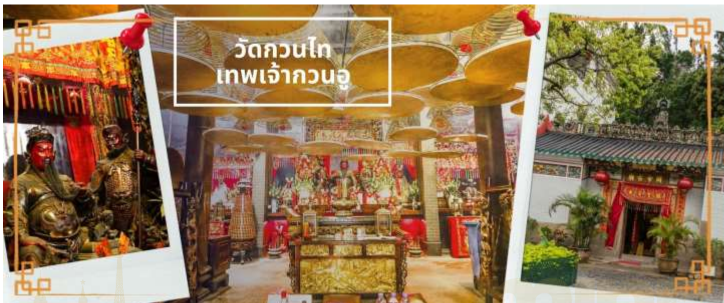
วัดกวนไท เทพเจ้ากวนอู

จากนั้นนำท่านเดินทางสู่ วัดกวนไท เป็นสถานศักดิ์สิทธิ์อันเลื่องชื่อ ถือว่าเป็นวัดแห่งเดียวในเขตเกาลูน ที่สร้างขึ้นเพื่อบูชา เทพเจ้ากวนอู ซึ่งท่านเป็นเทพเจ้าแห่งความซื่อสัตย์ เปี่ยมไปด้วยคุณธรรม โดยศาลเจ้าพ่อกวนอูแห่งนี้ ผู้ที่มาไหว้สักการะจะนิยมขอพรเรื่องธุรกิจและบิรวาร เนื่องจากว่า เจ้าพ่อกวนอู เป็นเทพเจ้าที่รักษาคำพูดด้วยชีวิต รักคุณธรรม ซื่อสัตย์ ช่วยปกป้องสิ่งเลวร้าย อันตรายต่าง ๆ และช่วยเสริมอำนาจบาปรมิในการปกครอง ท่านมีจิตใจมั่นคงตั้งขุนเขา มีสติปัญญาเป็นเลิศ และไม่ประมาท ท่านจึงเป็น