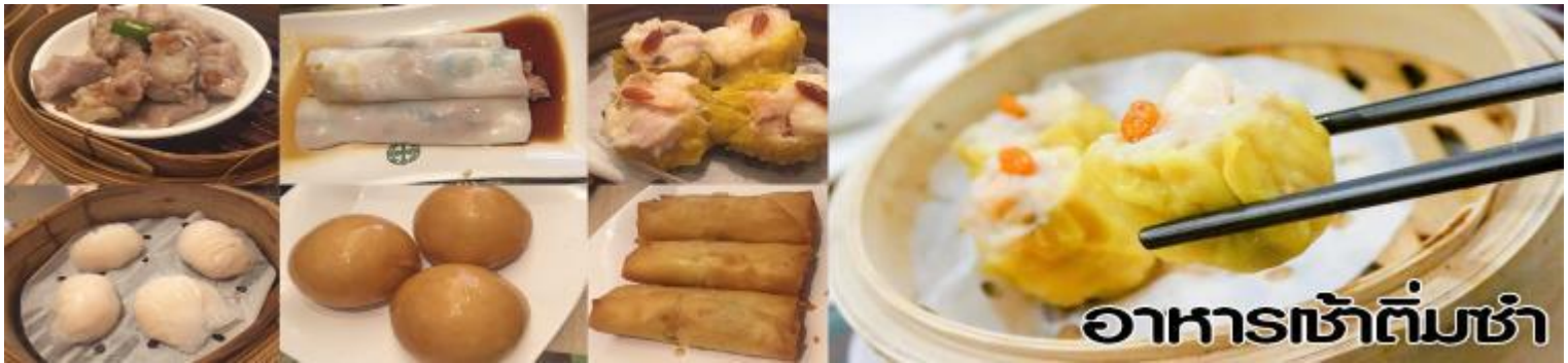
อาหารเช้าติ่มซำ

นำท่านไปไหว้ เจ้าแม่กวนอิมฮงฮำ (Kun Im Temple Hung Hom) เป็นวัดเจ้าแม่กวนอิมที่มีชื่อเสียงแห่งหนึ่งในฮ่องกง ขอพรเจ้าแม่กวนอิมพระโพธิสัตว์แห่งความเมตตา ช่วยคุ้มครองและปกป้องรักษาวัดเจ้าแม่กวนอิมที่ Hung Hom หรือ “Hung Hom Kwun Yum Temple” เป็นวัดเก่าแก่ของฮ่องกงสร้างตั้งแต่ปี ค.ศ. 1873 ถึงแม้จะเป็นวัดขนาดเล็กที่ไม่ได้สวยงามมากมาย แต่เป็นวัดเจ้าแม่กวนอิมที่ชาวฮ่องกงนับถือมาก แทบทุกวันจะมีคนมาบูชาขอพรกันแน่นวัด ถ้าใครที่ชอบเสียงเซียมซีเขาบอกว่าที่นี่แม่นมากที่พิเศษกว่านั้น นอกจากสักการะขอพรแล้วยังมีพิธีขอของอั้งเปาจากเจ้าแม่กวนอิมอีกด้วย ซึ่งคนส่วนใหญ่จะนิยมไปในเทศกาลตรุษจีนเพราะเป็นศิริมงคลในเทศกาลปีใหม่ ซึ่งทางวัดจะจำหน่ายอุปกรณ์สำหรับเซ่นไหว้พร้อมของแดงไว้ให้ผู้มาขอพร เมื่อสักการะขอพรโชคลากแล้วก็ให้นำของแดงมาวนเหนือกระถางรูปหน้าองค์เจ้าแม่กวนอิมตามเข็มนาฬิกา 3 รอบ และเก็บของแดงนั้นไว้ซึ่งภายในซองจะมีจำนวนเงินที่ทางวัดจะเขียนไว้มากน้อยแล้วแต่โชด ถ้าหากเราประสบความสำเร็จเมื่อมีโอกาสไปฮ่องกงอีกก็ค่อยกลับไปทำบุญ ช่วงเทศกาลตรุษจีนจะมีชาวฮ่องกงและนักท่องเที่ยวไปสักการะขอพรกันมากขนาด