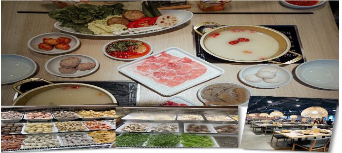
เที่ยง รับประทานอาหารเที่ยง ณ ภัตตาคาร (5) เมนูชาบู