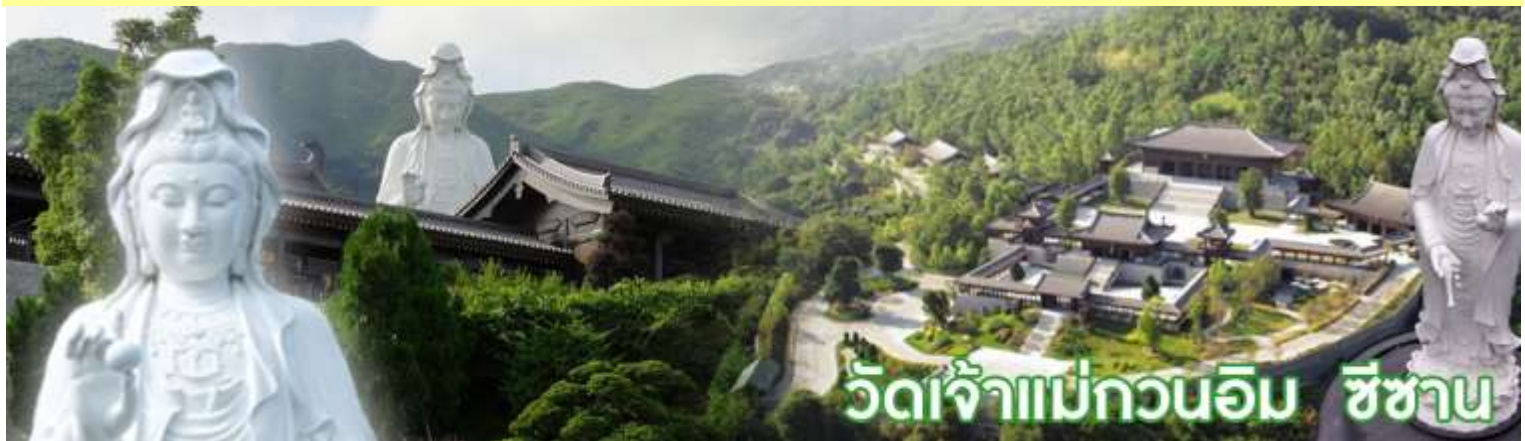
วัดเจ้าแม่กวนอิม ชีซาน

วัดชีซาน หลายคนที่เคยไปเที่ยวฮ่องกงมาแล้ว อาจจะยังไม่เคยเยือนวัดชีซาน หรือ Tsz Shan Monastery เป็นวัดที่มีเจ้าแม่กวนอิมองค์ใหญ่เป็นอันดับสองของโลก มีความสูงถึง 76 เมตร ตั้งอยู่บนเนื้อที่กว่า 29 ไร่ ในเกาะฮ่องกง โดยมีนาย ลี กาชิง มหาเศรษฐีชื่อดังของฮ่องกง บริจาคเงินสร้างวัดถึง 193 ล้านดอลลาร์เลยทีเดียว