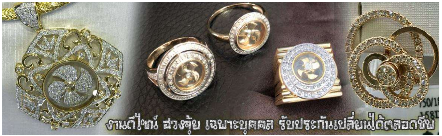
งานตีทอง สวยล้ำ เฉพาะบุคคล รับประกันเปลี่ยนไม่ติดตลอดชีพ

จากนั้นนำท่านสู่ ร้านหยก ชมความงามปีเซียะ ที่เชื่อกันว่าเป็นวัตถุมงคลยอดนิยม ที่มีการนำมาบูชา เพื่อให้ช่วยป้องกันสิ่งชั่วร้าย เรียกทรัพย์สินเงินทองให้ไหลมาเทมา และกักเก็บทรัพย์นั้นไม่ให้รั่วไหลออกไปไหนได้ ชาวจีนโบราณเชื่อกันว่า ปีเซียะเป็นสัตว์ประหลาดที่รวมลักษณะของสัตว์มงคลทั้ง 5 ชนิดไว้ด้วยกัน ได้แก่ มังกร พญาราชสีห์หรือสิงโต, อินทรี, กวาง, และแมว โดยตามตำนานเล่าว่า ปีเซียะเป็นลูกมังกรตัวที่ 9 (เทพแห่งโชคลาภ) ของพญามังกรสวรรค์ มีชื่อเรียกด้วยกันหลายชื่อไม่ว่าจะเป็น “เทียนลก (กวางสวรรค์)” เป็นชื่อเดิม ส่วนจีนกวางตุ้งจะเรียกว่า “เผ่ย้า” และคนจีนแต้จิ๋วจะเรียกว่า “ผีชีว” และยังมีจำหน่ายยาสมุนไพรบำรุงเพิ่มความแข็งแรงตามความเชื่อของคนฮ่องกง