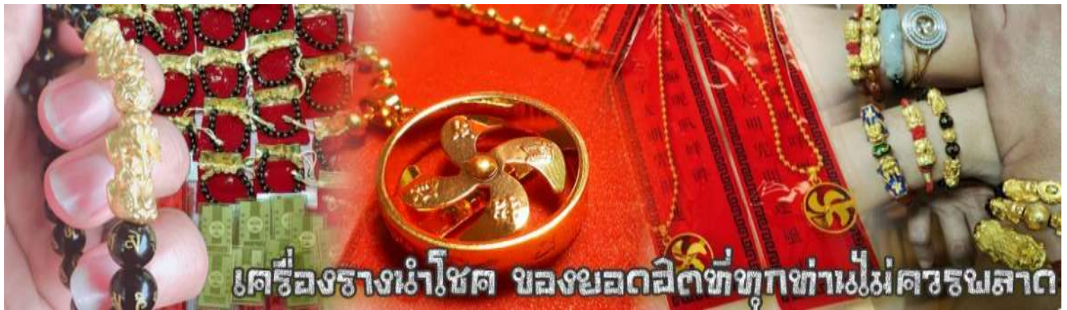
เครื่องรางนำโชค ของมงคลดีที่ทุกท่านไม่ควรพลาด

จากนั้นนำท่านสู่ ร้านหยก ชมความงามปีเซียะ ที่เชื่อกันว่าเป็นวัตถุมงคลยอดนิยม ที่มีการนำมาบูชา เพื่อให้ช่วยป้องกันสิ่งชั่วร้าย เรียกทรัพย์สินเงินทองให้ไหลมาเทมา และกักเก็บทรัพย์นั้นไม่ให้รั่วไหลออกไปไหนได้ ชาวจีนโบราณเชื่อกันว่า ปีเซียะเป็นสัตว์ประหลาดที่รวมลักษณะของสัตว์มงคลทั้ง 5 ชนิดไว้ด้วยกัน ได้แก่ มังกร พญาราชสีห์หรือสิงโต, อินทรี, กวาง, และแมว โดยตามตำนานเล่าว่า ปีเซียะเป็นลูกมังกรตัวที่ 9 (เทพแห่งโชคลาภ) ของพญามังกรสวรรค์ มีชื่อเรียกด้วยกันหลายชื่อไม่ว่าจะเป็น “เทียนลก (กวางสวรรค์)” เป็นชื่อเดิม ส่วนจีนกวางตุ้งจะเรียกว่า “เผ่ย้า” และคนจีนแต้จิ๋วจะเรียกว่า “ผีชีว” และยังมีจำหน่ายยาสมุนไพรบำรุงเพิ่มความแข็งแรงตามความเชื่อของคนฮ่องกง