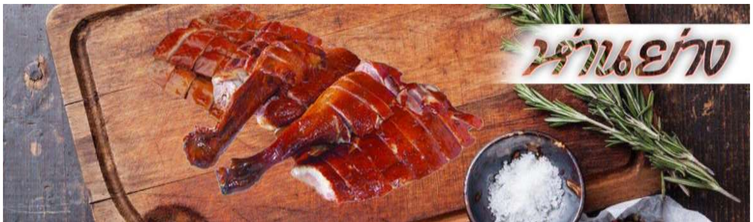
ห่านย่าง

เที่ยง รับประทานอาหาร ณ ภัตตาคาร ****เมนูทานอย่างต้นตำหรับฮ่องกงแสนอร่อย****