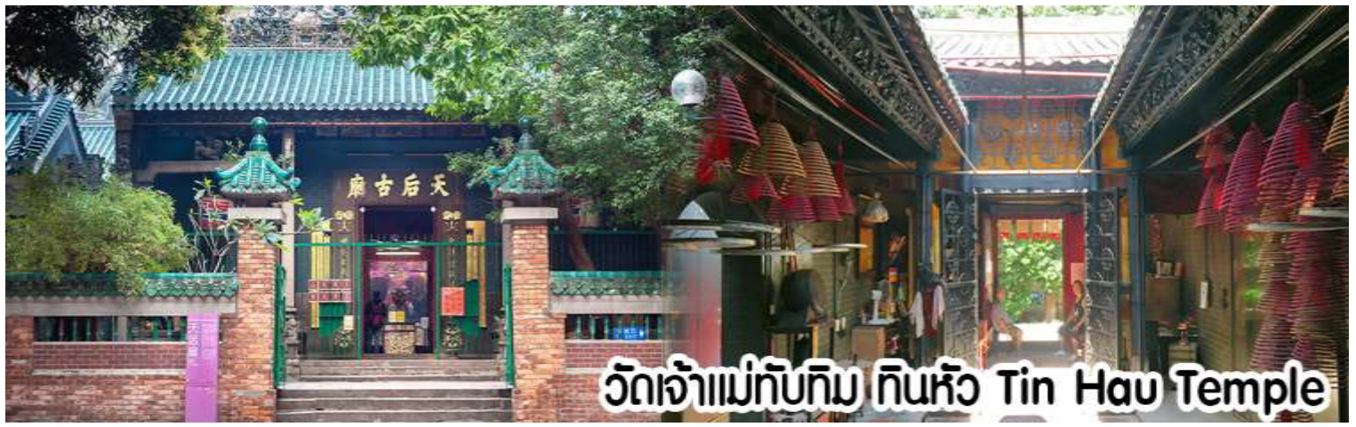
วัดเจ้าแม่ทับทิม ทินหัว Tin Hau Temple